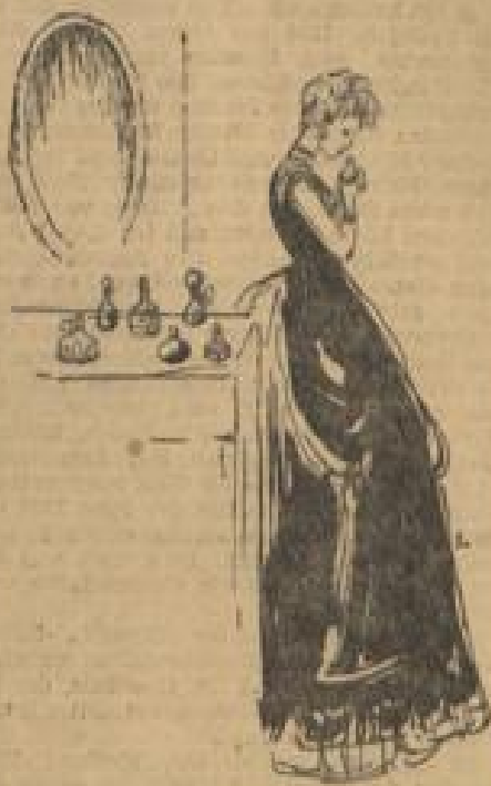
Zeichnung: Hanna Nagel