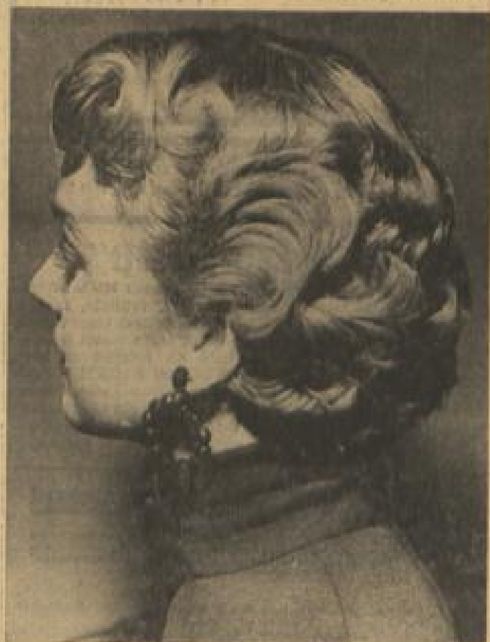
Auch eine neue Frisur soll sich nach 1934 durchsetzen, wie Pariser Meisterfrisuren behaupten. Hier entschied man sich für die gemilderte Linie, weder Windstöße noch Schürzenlocken. Aber immerhin — die Haare werden langsam wieder länger...

Gewiß, das Haar braucht Luft, um zu gedeihen, doch darf man nicht übertreiben, weil sonst das Gegenteil erreicht würde. Es ist eine weit verbreitete Unsitte, auch bei kaltem Wetter ohne Kopfbedeckung ins Freie zu gehen, ja vielleicht den ganzen Winter über keinen Hut zu tragen. Wer darüber den Arzt befragt, der wird erfahren, daß es dadurch zu einem veralteten Haarausfall kommen kann und daß leicht Erkältungen des Kopfes, der Ohren und der Kopfnerven entstehen können, die schmerzhaft sind und nur langsam wieder weichen. Auch wird man hören, daß gerade im Winter frühestens alle vier Wochen einmal der Kopf gewaschen werden darf, wobei streng darauf zu achten ist, daß man nicht mit feuchtem Haar ins Freie geht. Je öfter man nämlich das Haar wäscht, desto mehr werden die Pforten angeregt, desto schneller wird das Haar fettig und strählig. Wer unter fettigem Haar leidet, kann zwichendurch einmal eine Trockenwäsche mit dem einschlägigen Puder vornehmen, um wieder lockeres Haar zu bekommen.