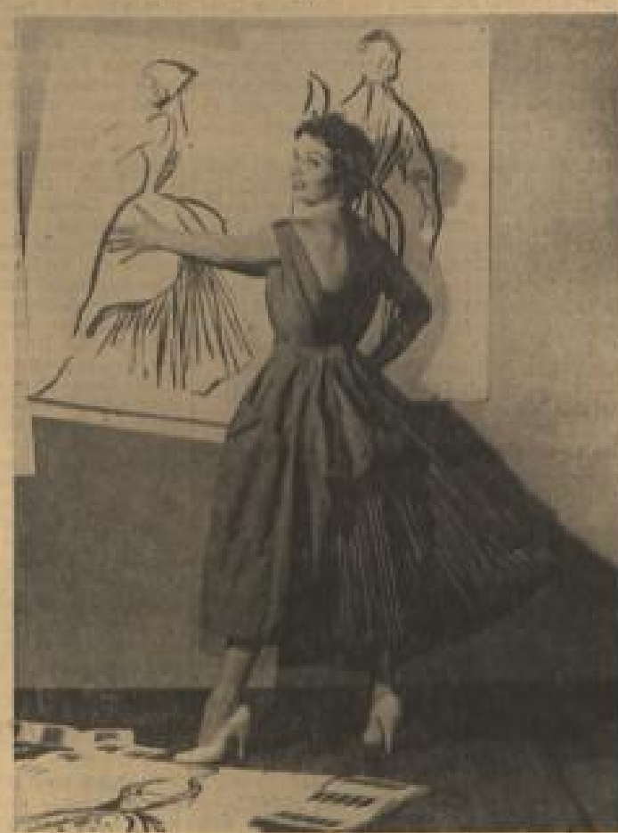
Fine ganz neue Mode will Italien für 1934 auf den Plan bringen. In Turin wurde dieser Vorfrühlingsmode des Südens gezeigt, der aus zwei Schürzen besteht und zunächst erhebliche Verwirrung unter den Gemütern angerichtet hat.

über gewöhnliche Lampenbirne streift, einen ganzen Raum mit ihrem Duft erfüllen oder elektrische Parfümerie, es gibt das Haarparfüm, das irgendein Meisterfriseur geschaffen hat.