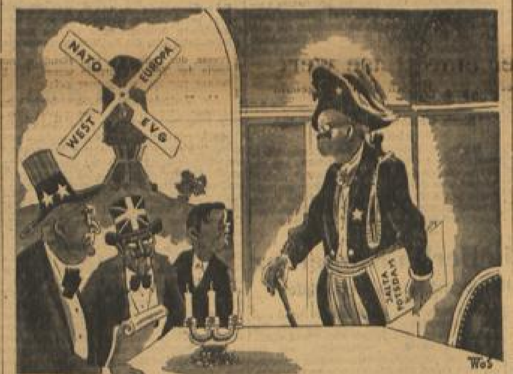
„Er kann nun mal die Windmühlen nicht leiden...“

Das französische Oberkommando hat am Mittwoch Nachrichten über Nord-Laos veröffentlicht. Das französische Oberkommando ist bemüht, in einem Halbkreis, etwa fünfzig Kilometer östlich der Hauptstadt, mehrere Sperrriegel aufzubauen. Luang Prabang selbst wird in feberhafter Eile in Verteidigungslage versetzt.