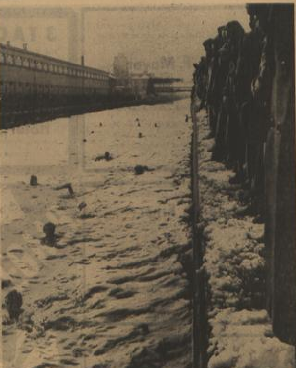
Trotz Schnee und Eis und bei fast zehn Grad Kälte nahmen „eisernen“ Sportler in Mailand am Freibad. Die Zuschauer dieses ungewöhnlichen Sportereignisses bekamen zwar kalte Füße, aber dafür erfrischende Schwimmstunden zu sehen, denn es handelte sich um einen Winterschwimmwettbewerb.

Rinteln (Weber). 4. Febr. Zwei Stunden kämpfte ein 30jähriger Nachtwächter in Engers bei Rinteln mit dem Kältefrost. Bei einem stücklichen Rundgang durch die Wälder auf einem Fabrikgelände in eine mit Wasser gefüllte Kiesgrube. Dabei durchbrach er das Eis. Nur mit dem Kopf und den Händen aus dem Eisloch ragend rief er die ganze Zeit hindurch um Hilfe. Als Arbeiter ihn schließlich fanden, war der Körper des Nachtwächters im Eis festgefroren.