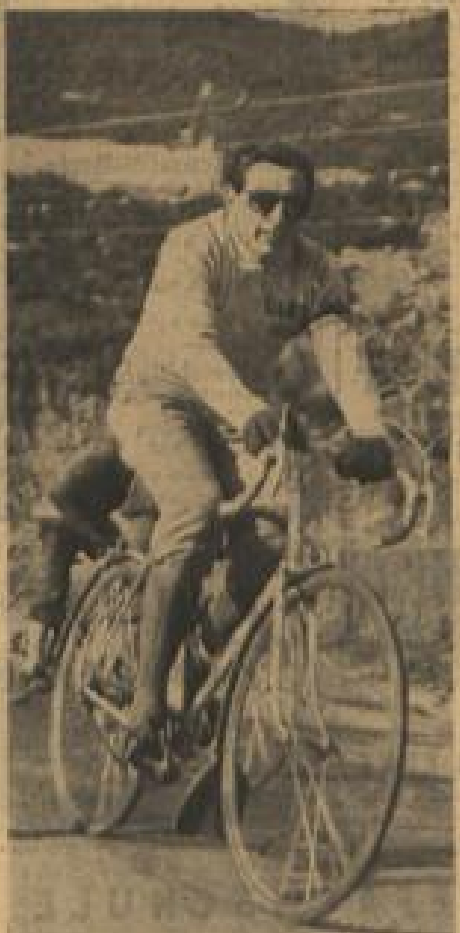
Fausto Coppi Das italienische Radrennfahrer-Ast, trainiert jetzt schon an der Riviera eifrig für das Radrennen „Mailand-San Remo“.