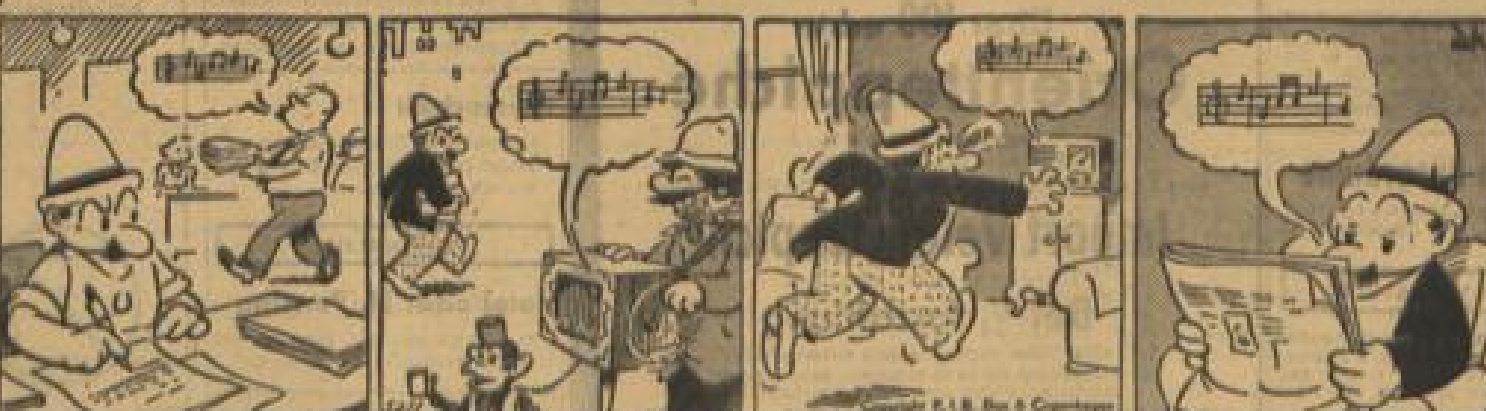
Die schönste Melodie auf Erden kann einem überdrüssig werden, wenn man sie auf der Straße hört. Man hört sie selbst dann noch zu Hause! Man grüßt und stellt den Kasten aus. Man hört sie selbst dann noch zu Hause! Man grüßt und stellt den Kasten aus. Und spielt ein Lied — das gleiche, schon! Das ist die Allgewalt der Töne.