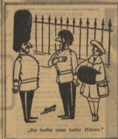
„Sie hatte 3000 halbe Hände.“