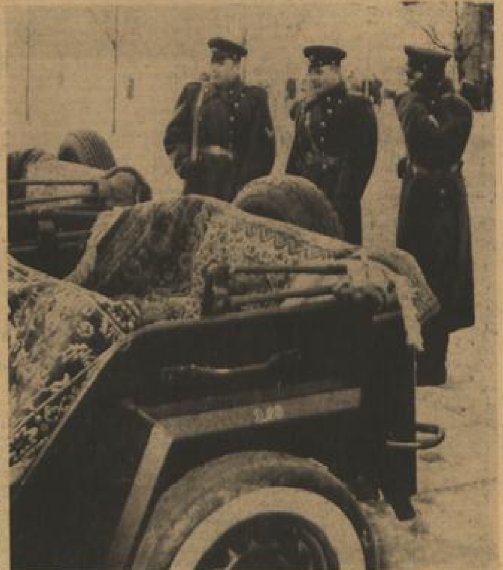
Die Sowjets wissen, was sich gehört: Die gewöhnlichen Militär-Jeeps schienen dem sowjetischen Kommando nicht vornehm genug für das Begleitkommando, das die westlichen Außenminister zu den Konferenzen in der Odeberger Sowjetbotschaft geleitet. Jetzt sitzt das Begleitkommando statt auf Holzboxen auf kostbaren Perserteppichen.

Berlin, 3. Febr. (UP) Sowjetzonen-Ministerpräsident Otto Grotewohl (SED) hat am Mittwochabend die „Volkskammer“ aufgefordert, das deutsche Volk zu einer gesamtdeutschen Volksabstimmung über die Frage „Friedensvertrag“ oder „Deutschland-Verträge der Bundesregierung“ aufzurufen.