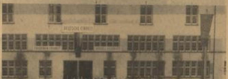
Die Markkundgebung auf dem Universitätsplatz