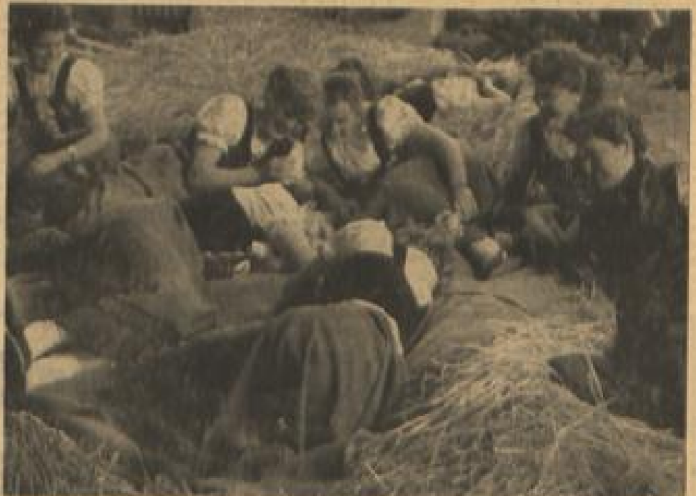
Nachtquartiere in den Schulhäusern