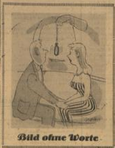
Bild ohne Worte