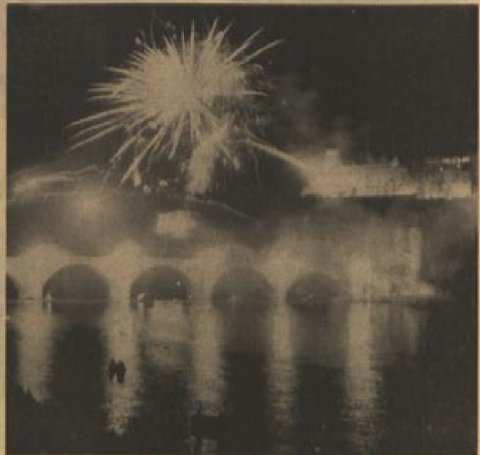
120 000 sehen die Schloßbeleuchtung