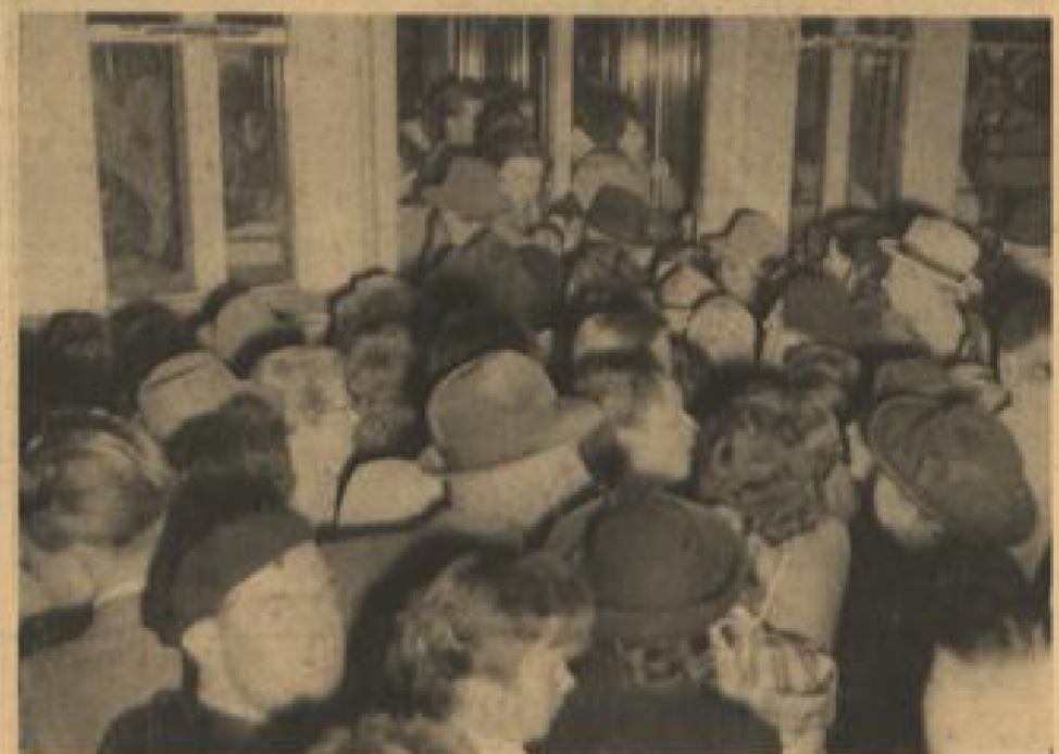
Nach der Schloßbeleuchtung — Sturm auf die Straßenbahnen

20 Uhr Die Gäste sind meist schon abgereist. Die Stadt wird leerer. Ganz zuletzt konzentriert sich der Fußgänger-verkehr auf den Bahnhof. Ein Lautsprecherwagen rollt langsam durch die Stadt und eine Stimme dankt den Heidelbergern für ihre Gastfreundschaft. Eine Belastungsprobe erster Ordnung war glänzend und allen Unkenrufen zum Trotz bestanden worden.