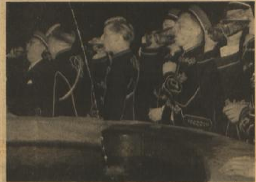
Auf dem Marktplatz sangen die Alemannen den Mai ein