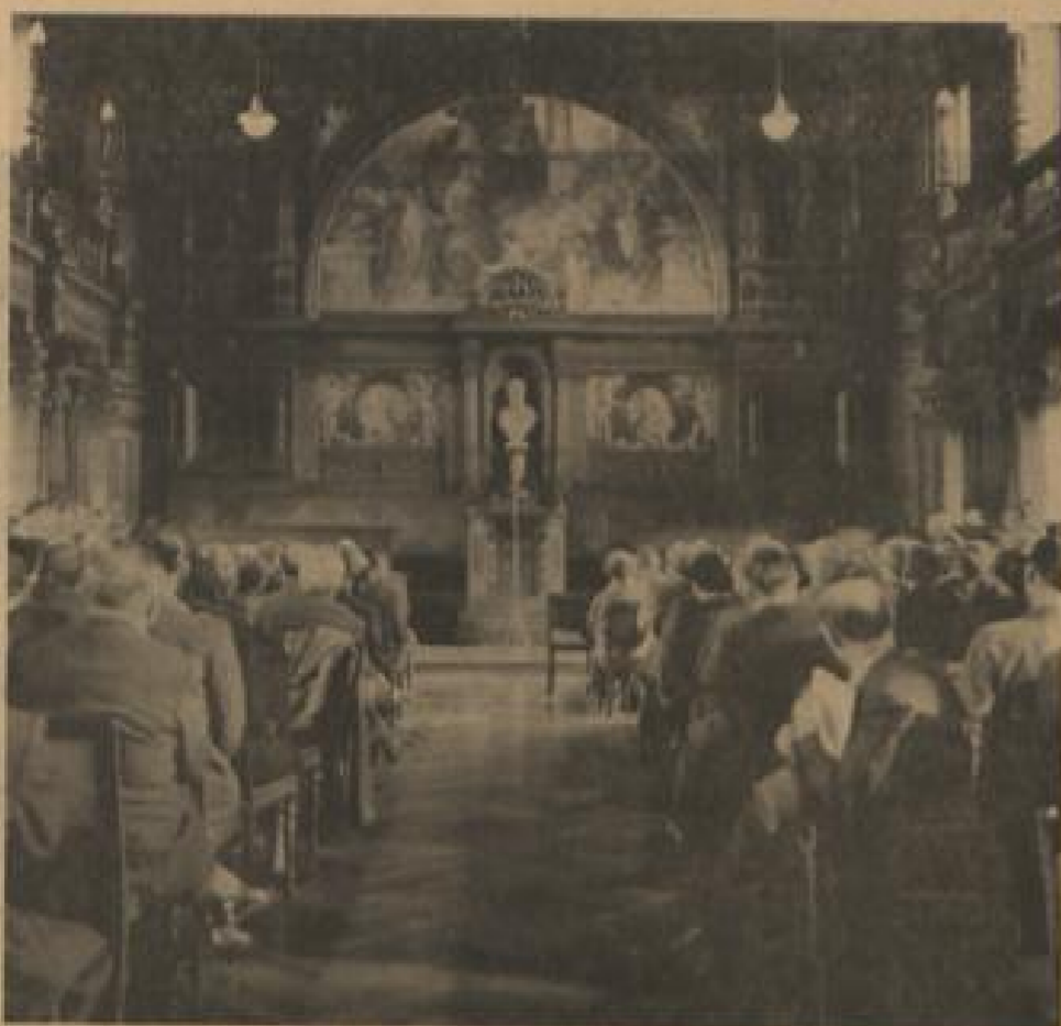
Bundesminister Oberländer sprach bei der Hochschalung