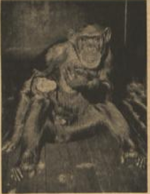
Zwei Schimpansen wurden dieser Tage im Männer Tierpark Hellabrunn geboren — ein einziger Zuchterfolg, denn Schimpansen kommen in der Gefangenschaft noch seltener als Elefanten zur Welt. Die beiden Mütter (auf unserem Bild) und Spitz sind als Filmpartner von Hans Albers und Harry Piel bekanntgeworden.

GRIECHER LETZTER WILLE. Betroffen stellte man in Oslo fest, daß man ungewollt den letzten Willen des Komponisten Edward Grieg nicht respektiert hatte, als ein Verlag ein Manuskript veröffentlichte, auf dem der handschriftliche Vermerk stand, daß es nach Griegs Tode zu vernichten sei. Es handelt sich um 1 Stücke für Klavier aus dem Jahre 1860, die nun nicht mehr im Radio, wie beabsichtigt, gesendet werden sollen.