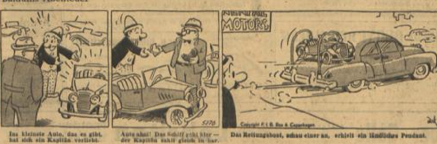
Ins kleinste Auto, das es gibt, hat sich ein Kapitän verlobt. Auto ab! Das Schiff geht hier — der Kapitän taucht gleich in der. Das Rettungsboot, ohne einen an, schickt ein handliches Produkt.