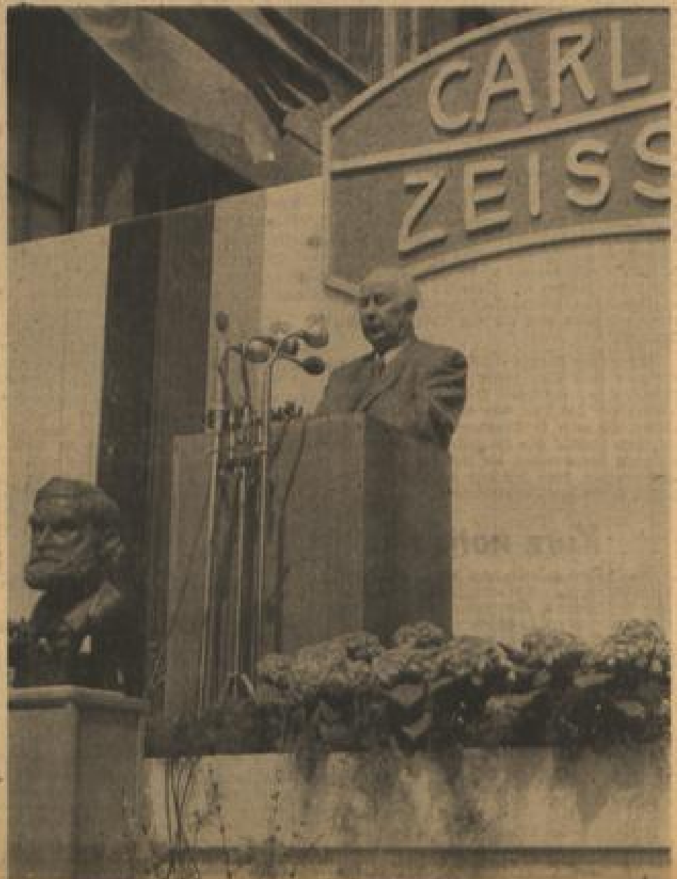
Die Arbeiter der Zeiss-Werke in Oberkochen (Württemberg) hatten am 1. Mai das Staatsobsequium zu Gast. Bundespräsident Theodor Heuss wies in seiner von allen deutschen Sendern übertragenen Ansprache auf die große Bedeutung hin, die Arbeiter und Unternehmer gleichermaßen für die deutsche Wirtschaft haben. Ausgehend von einer Würdigung des Sozialwerkes Zeiss-Stiftung Carl Zeiss (siehe Bild) im Vordergrund des Bildes begrüßte Heuss die gezielte Verpfändung der Zeiss-Werke von Thüringen nach Württemberg. Die Fragen, die sich im Zusammenhang mit der etwaigen Einführung der Fünf-Tage-Woche stellen, lassen sich nach Auffassung von Prof. Heuss heute noch nicht generell beantworten. Er befürwortete eine „intensive“ statt einer „expansiven Lohnpolitik“. Darunter versteht der Bundespräsident „die Entwicklung jener Produktion, bei der ein Maximum von Lohn, das heißt menschlichen Geist, menschlicher Fähigkeit, in ein Minimum von Rohstoffen gesteckt wird“. Damit allein wird unser aller Leben in den Schwankungen des Weltmarktes gerettet.

Eine 45-Stunden-Woche bei neunstündiger täglicher Arbeitszeit und freiem Samstag befürwortete der badisch-württembergische Arbeitsminister Erwin Hohlwegler (SPD) als Übergangslösung auf einer Mai-Kundgebung in der nordbadischen Industriegemeinde Grensch. Der freie Samstag könne für sportliche, gesellige oder kulturelle Anlässe dienen und der Sonntag dann ganz der Familie, der Erholung und der religiösen Erbauung gehören. Hohlwegler verwies darauf, daß viele Betriebe in Baden-Württemberg bereits die 45-Stunden-Woche eingeführt und außerdem bedeutend höhere Leistungen ihrer Belegschaften verzeichnet haben.