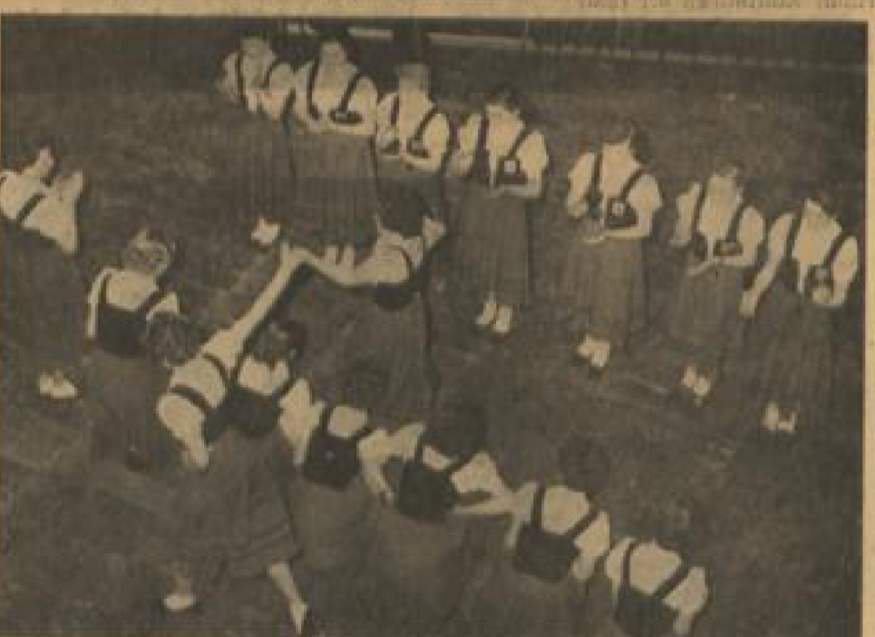
Trachtengruppe beim „Leinwand-Tanz“