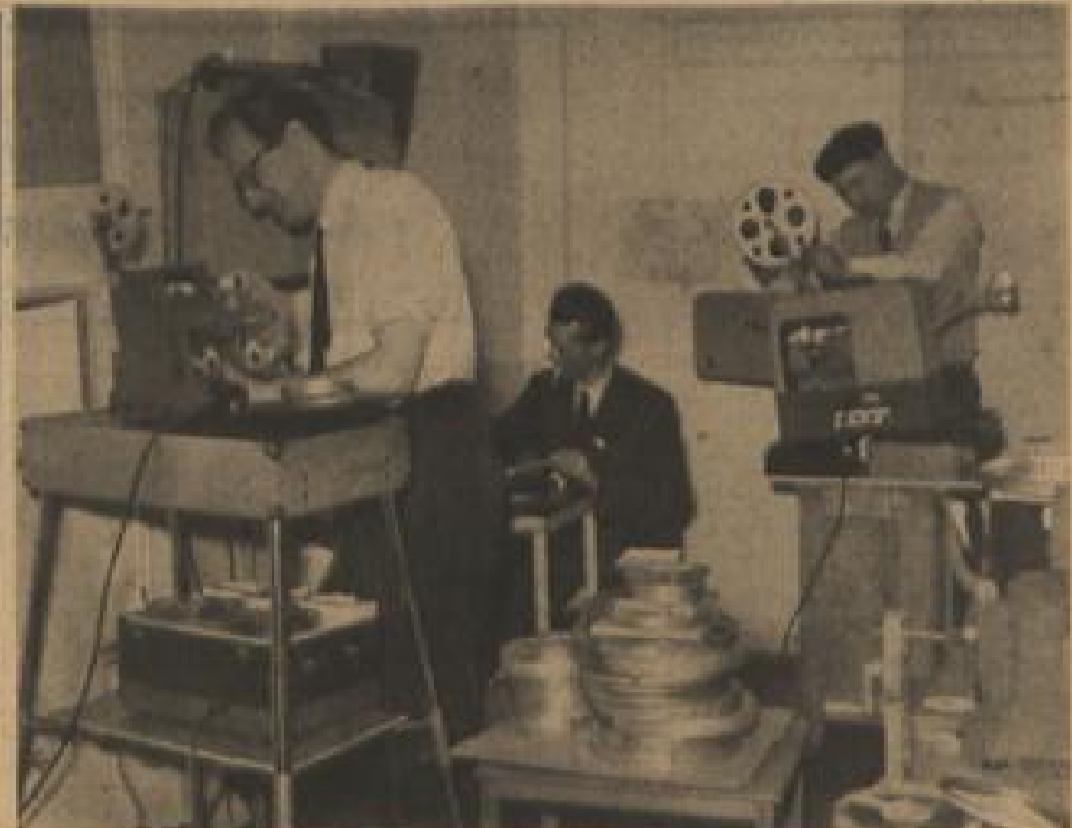
Schmalfilm-Wettbewerb in Frankfurt Vom 30. April bis zum 2. Mai wurde in Frankfurt der XII. Nationale Deutsche Amateurfilm-Wettbewerb durchgeführt, der alljährlich als Ausschreibungskamp für die Teilnahme am Internationalen Amateurfilm-Kongress der UNICA gilt. Insgesamt 77 Filme wurden zum Frankfurter Wettbewerb eingereicht. Das Spielstücken mit 25 Einsendungen an der Spitze. Unser Bild zeigt einen Blick in den Vorführsaal im Frankfurter Volkshaus, wo sich die auf die Vorführung wartenden Wettbewerbsfilme stapeln.