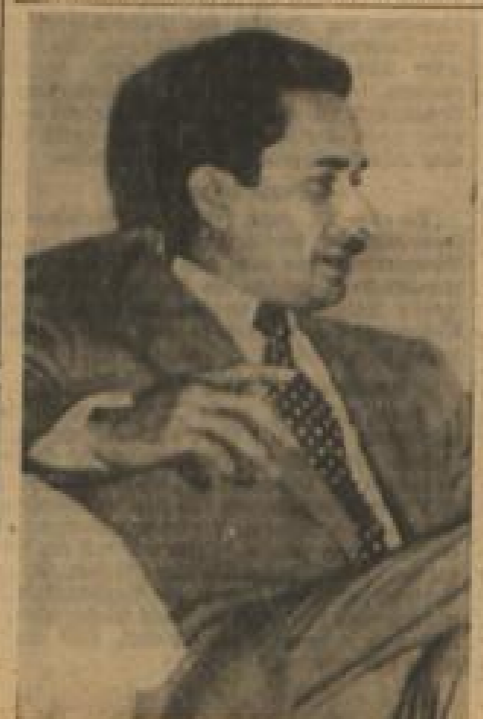
Das ist der Führer der „Befreiungsarmee“, die zur Zeit der von den linkeorientierten Elementen des Landes gestützten Regierung der Herrschaft in Guatemala zu entwerfen versucht. Oberst Castillo Armas.

Sicherheitsrat einberufen New York, 23. Juni. (dpa) Der Sicherheitsrat ist für Freitagabend einberufen worden, um über die Lage in Guatemala zu beraten.