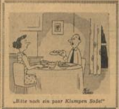
„Bitte noch ein paar Klampen Soße“