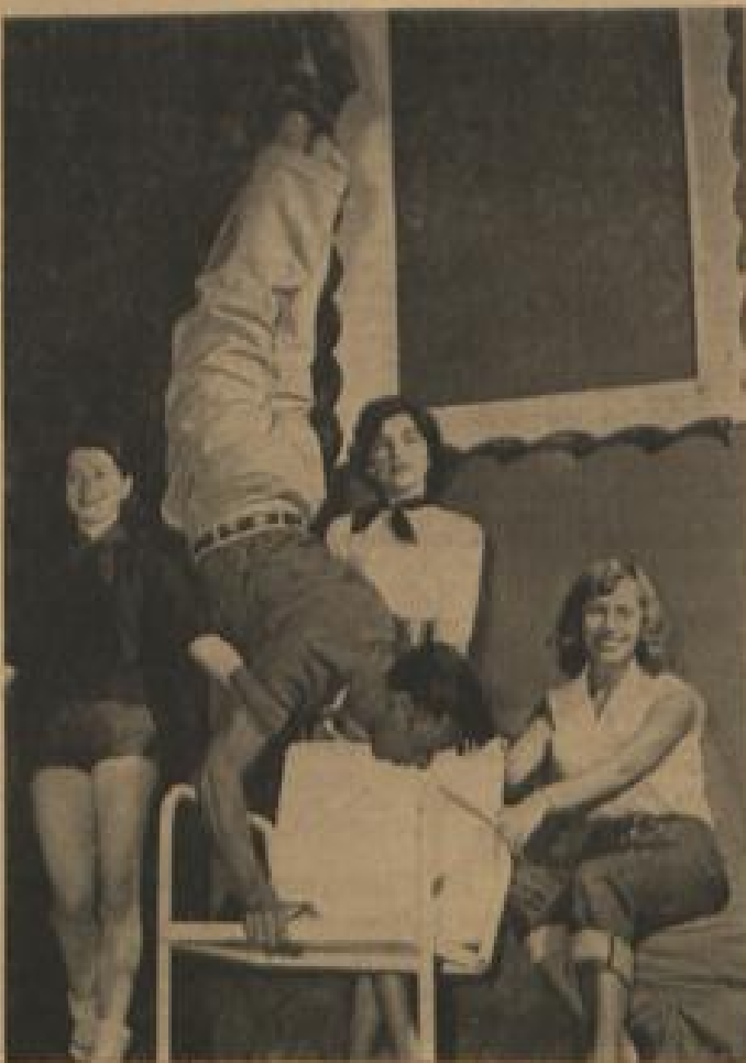
Bei der Probe im Broadway-Theater in Rohrbach

„Keine Zeit für Liebe“ / Musikrevue als Hilfe für GYA