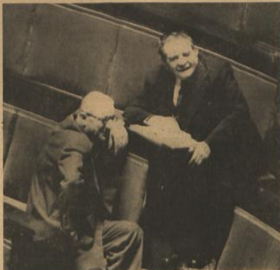
Mit Edouard Herriot, dem greisen Ehrenpräsidenten der französischen Nationalversammlung, setzte sich am Montag in Paris die Stimme der älteren Generation durch, die keine Antwort auf die Fragen weiß, die Gegenwart und Zukunft unerbittlich stellen: Die Einheit der freien Völker. „Die Strangulation der Debatte hatte Erfolg“, erklärte die Pariser Zeitung „Figaro“ und setzte hinzu: „Ein schwarzer Vorhang schloß sich langsam und minutiös über dieses Begräbnis zu breiten. Man kann Angst vor dem Morgen bekommen. Das Heute ist anders. Man schämt sich.“ Diese Scham aber wird weiterleben, und die junge Generation in Frankreich wird sich ebenso wie die der anderen Völker Europas um ihre Zukunft betreten lassen. Diese Zukunft aber kann nur heißen: Heraus aus der tödlichen Verküftung der Nationalstaaten und sich zusammenschließen zu einer die Grenzen und das Mißtrauen vererbenden Zusammenarbeit. — (Unser Bild zeigt E. Herriot auf der Abgeordnetentagung im Gespräch mit einem Parlamentarier.)