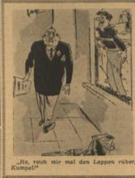
„He, reich mir mal den Lappen rüber, Kumpel!“

Wenn eine der Frauen in diesem „Kabinett“ dann verschwindet, so bemächtigt sich der im Wartezimmer versammelten eine besondere Erregung, und jede der hier versammelten Frauen beneidet die so besonders Bevorzugte.