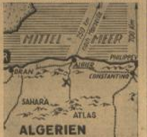
Das Kreuz bezeichnet die ungefähre Lage des Katastrophengebietes.

Flieger, die die Stadt Oranville aus der Luft beobachten konnten, berichteten, daß sich das Bild einer von Bomben zerstörten Stadt