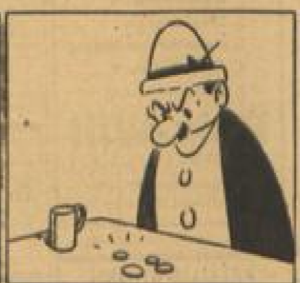
Und unsern armen Orgsieder's verdriest natürlich niches sehr.