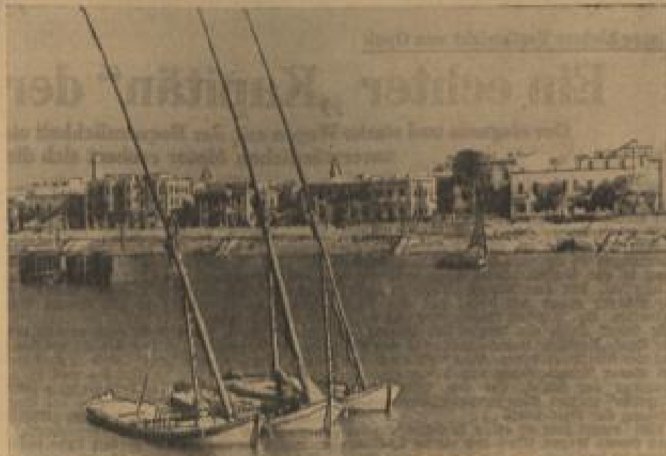
Träge und dünn fließt heute der Nil dahin. In wenigen Jahren werden riesige Staudämme den Fluß zur Arbeit in neuen Kraftwerken zwingen und Kanäle sein kostbares Nil wasser ins Land tragen.

Alljährlich zwischen Juli und Oktober steigen infolge der Regenfälle die Wasserstände über ihre Ufer und überschwemmen endlose Gebiete des Landes. Das ist kein Unglück, im Gegenteil, der mitgeführte Schlamm ermöglicht erst die Bodenkultur. Jedoch diesen wenigen Monaten der Fülle steht die übrige Zeit des Jahres mit einem ausgesprochenen Wassermangel entgegen, dessen Folgen oft Mägen und Hungertoten sind. Mehrere Stauseen im oberen Nilgebiet, von den Engländern angelegt, bannen die schlimmste Gefahr, aber sie reichen bei weitem nicht aus. Nun soll im Mittel bei Assuan ein riesiger Staudamm errichtet werden, um so Wasservorräte zu schaffen und der Wüste Tausende von Quadratkilometern fruchtbareren Ackerlandes abzurufen. Um diesen kühnen Plan, der schon Alexander den Großen und die alten Ägypter vor 3000 Jahren bewog, wird es jetzt ernst. Zwar gibt es schon einen von deutschen Ingenieuren errichteten Staudamm bei Assuan mit zwei Kilometern Länge, so ist einer der größten der Welt. Der neue Staudamm aber wird ihn, ja sogar den amerikanischen Boulder-Damm und den russischen Dnepr-Damm weit in den Schatten stellen. Hinter seinen Betonmauern soll der Nil auf 600 Kilometer Länge gestaut werden! 175 Millionen Kubikmeter Nilwasser, das ist das Tausendfache dessen, was die für unsere Begriffe "riesige" Mähnsperre enthält, werden in diesem gewaltigen Reservoir Platz finden!