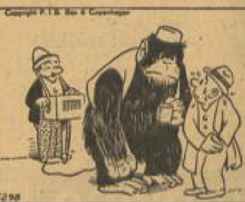
Die Bären werden nicht verrammelt, sobald ein Orang-Utan sammelt.