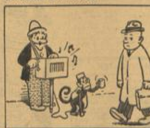
Wie süß auch ein Schlupfchen sei, die meisten gehn an ihm vorbei.