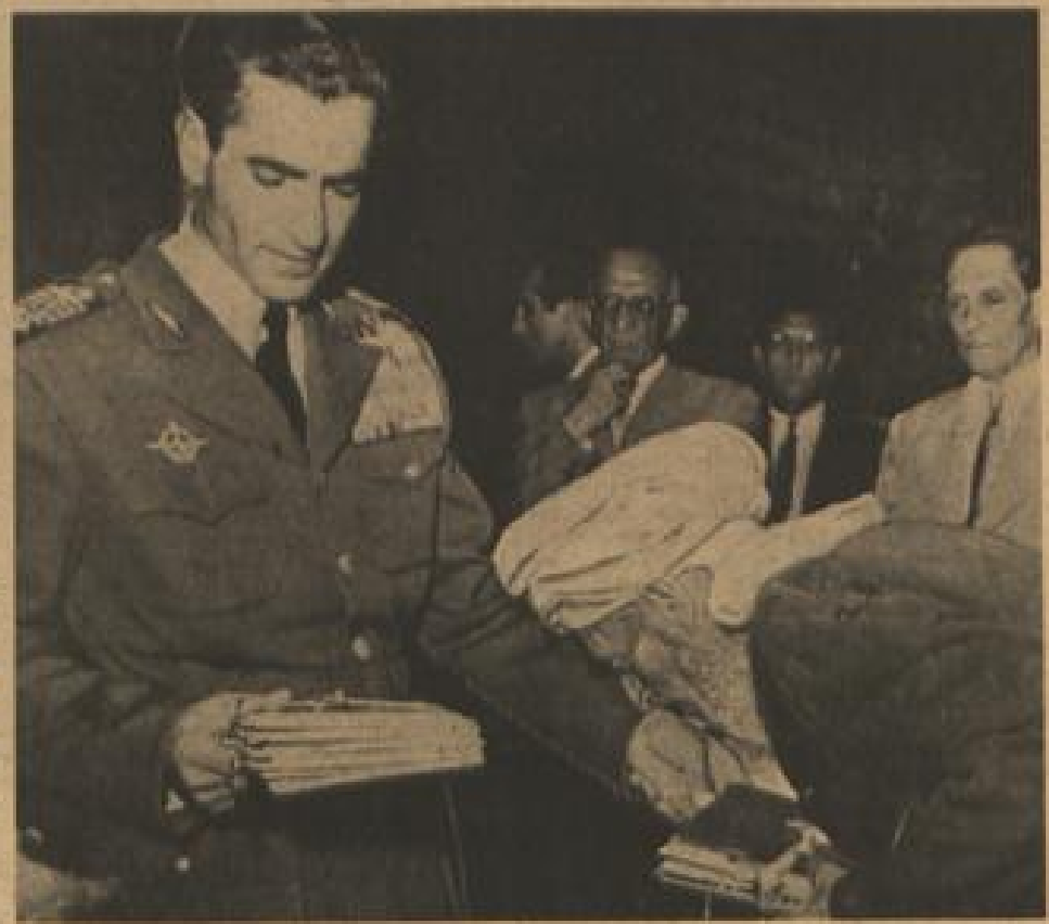
Wie überall, so sucht auch in Persien der Kommunismus seine Hauptstütze bei den landlosen Bauern. Der Schah weiß das und sucht der kommunistischen Propaganda durch eine wirkungsvollere eigene Propaganda entgegenzuwirken; er verteilt aus dem reichen Grundbesitz, der der Schah-Familie gehört, kostenloses Land an arme Bauern. Hier küßt ihm ein Bauer, dem er eben die Uebereignungsurkunde überreicht hat, voll Dankbarkeit die Hand.

Der französische Ministerpräsident Mendès-France hat dem Generalgouverneur von Algerien in einem Telegramm das Mitgefühl seiner Regierung zum Ausdruck gebracht. Der NATO-Generalsekretär Lord Ismay hat Frankreich jede Unterstützung zugesichert, die die Atlantikpakt-Organisation gewähren kann.