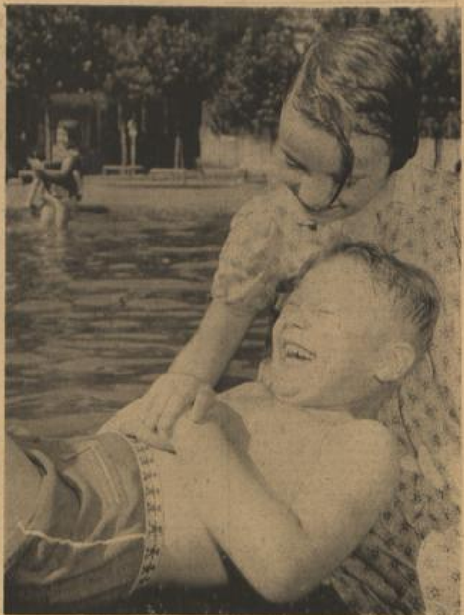
Es war so schön gewesen...

So erfährt von Jahr zu Jahr, von Saison zu Saison, unser neues Schwimmbad erfreuliche Verbesserungen, wird es zu einem immer noch schöneren Ort der Erholung. Darum sei zu Schluß dieses Saisonberichtes nochmals allen gedankt, die mitgeholfen haben, dieses Bad zu schaffen, sei allen gedankt, die — in der Verwaltung, am Schalter, in der Garderobe oder sonnstwo — im Dienst am Bade-Kunden standen. h.