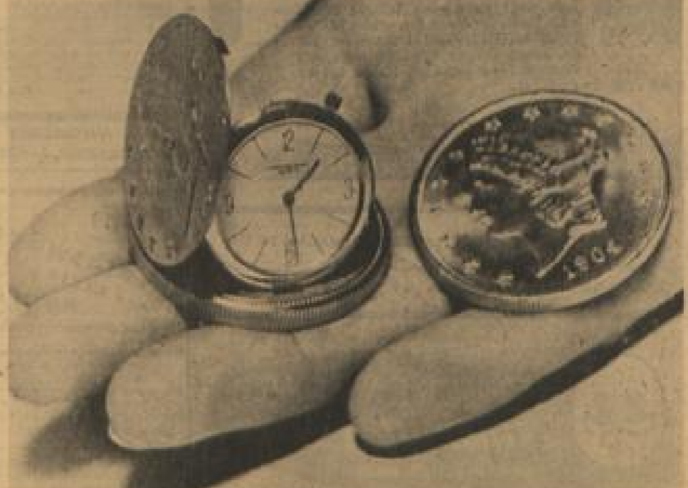
Die Dollaruhr - eine modische Neuheit Ein Kölner Juwelier hat eine neue Attraktion eingestrichelt: die Dollaruhr. In ein gefuchstenes amerikanisches 20-Dollar-Stück aus reinem Gold hat ein Schweizer die feinste Uhr der Welt gebaut. Dieses Meisterwerk kostet 3800 DM.