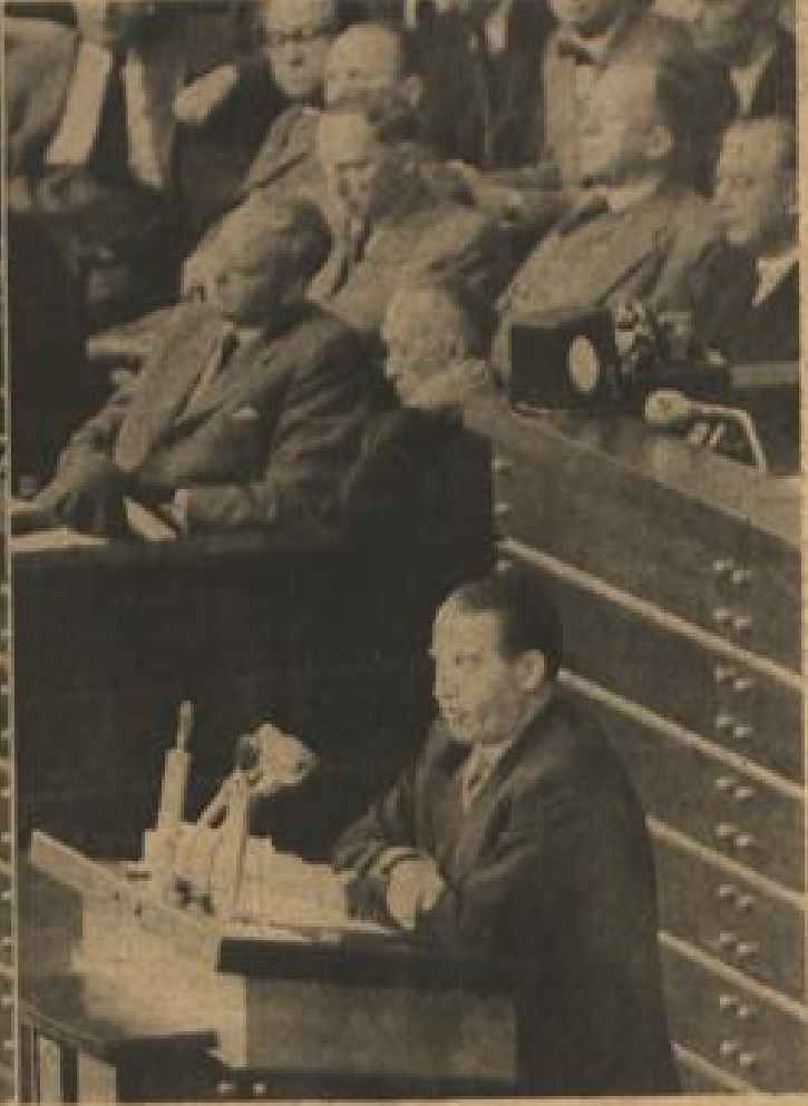
Regierungsbank: der Bundeskanzler Dr. Adenauer, der an diesem Tage, der ja nicht nur der John-Debatte im Bundestag, sondern auch den für unsere Außenpolitik entscheidend wichtigen Besprechungen mit dem amerikanischen Außenminister Foster Dulles gewirkt hat, wieder einmal ein erstaunliches Beispiel seiner Leistungsfähigkeit abgibt.