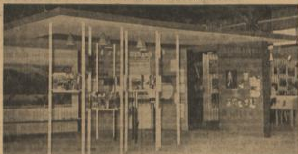
Heidelberg im Blickpunkt der Ausstellung