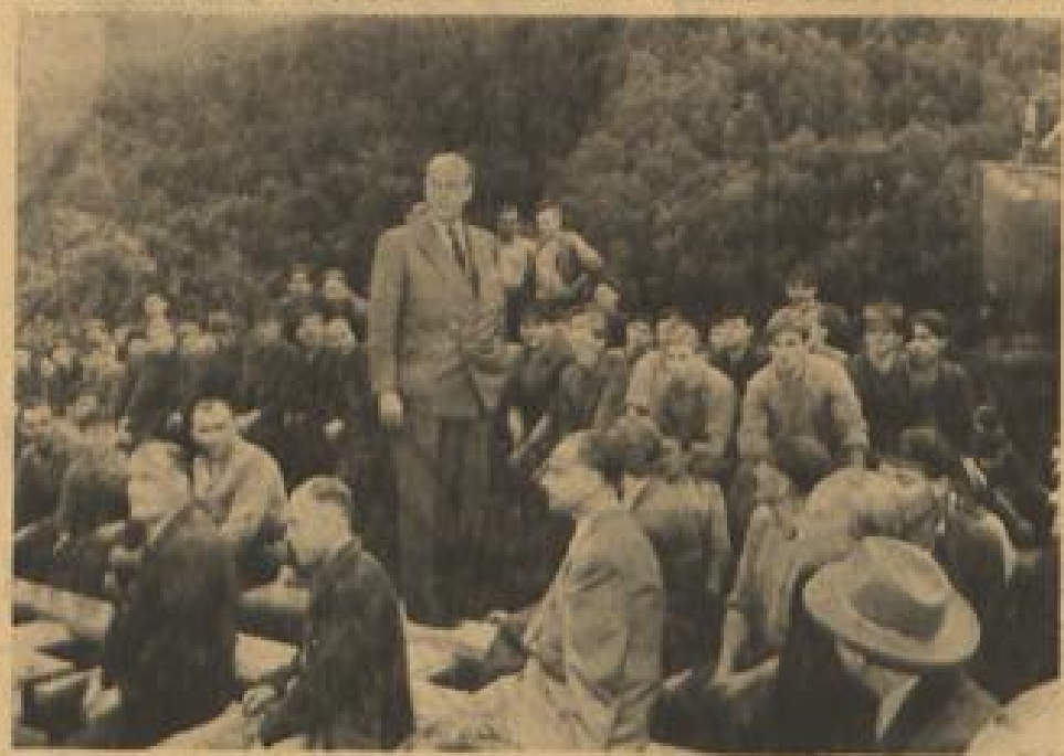
MINISTERPRÄSIDENT DR. ZINN besuchte in Neckarsteinach die Schiffswerft der F. P. Philipp Ebert, um sich an Ort und Stelle über den Stand der Neckarschiffahrt zu informieren.

Auch die Gastwirte haben in emsiger Arbeit ihre Vorbereitungen zu diesem Feste getroffen. Sie werden es sich nicht nehmen lassen, ihre Gäste zur vollsten Zufriedenheit zu bedienen. — Und nicht zuletzt die Hausfrauen, welche ihren sogenannten Kerweputz zur Freude ihrer Ehemänner benutzen haben, treffen nun noch ihre letzten Vorbereitungen und werden auch die Fertigstellung des traditionellen Kerweschens nicht vergessen. In diesem Ester nicht die gesamte Einwohnerschaft dem bevorstehenden Feste erwartungsvoll entgegen.