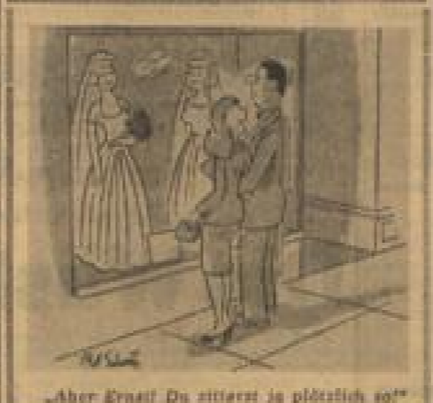
„Aber Ernst! Du sitztest ja plötzlich so!“

als eine vaterländische und ideale Tat und opferte ihr einen großen Teil seines wirklichen Wesens, das seiner zartbesaiteten Seele in einer so menschlich verstehenden Form entsprang. Auch an diesem Tage war er nur in den Salon der Golowinas gekommen, weil er ahnte, daß hier der beste Platz war, Rasputin in eine tödliche Falle zu locken. Er hatte sich den ganzen Abend mit Grigori unterhalten. Sie hatten beide wieder ihre Lieder gesungen, getrunken, und der abendliche, sonst ewig militärische „Starret“ hatte dem Fürsten immer wieder auf die Schultern geklopft und ihn brüderlich isarnart. (Fortsetzung folgt)