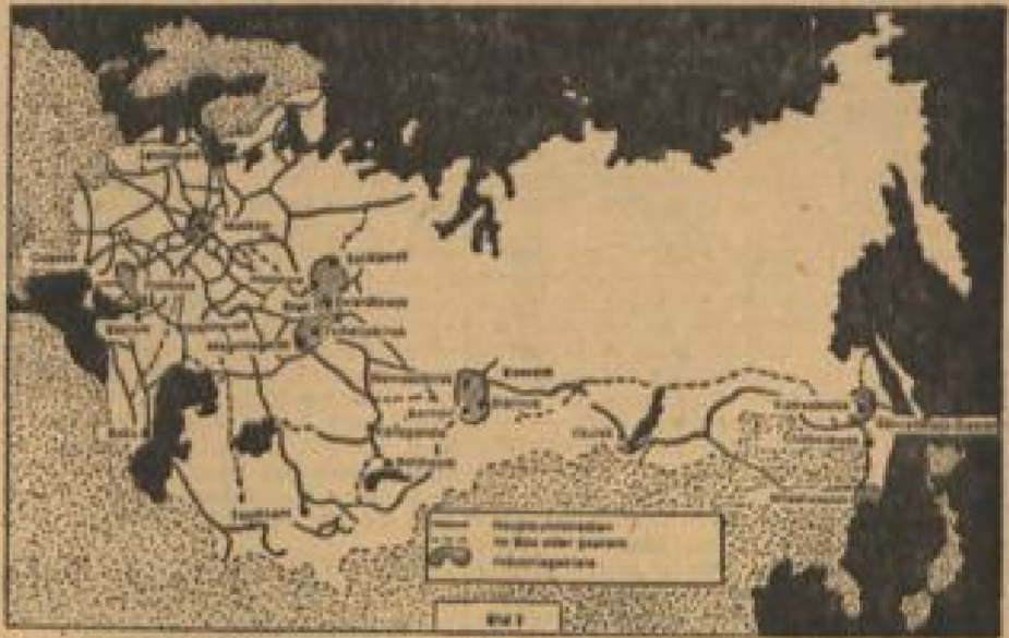
Das Eisenbahnsystem und die Industriegebiete der Sowjetunion

Widerstand trifft und abgebrannt wird, bis die USA mit einem Expeditionskorps, mit ihrem Material, ihren See- und Luftstreitkräften eingreifen können, während zugleich schwere Luftangriffe über dem sowjetischen Hinterland niedergehen, dann würden nach und nach die Schwächen des Systems sichtbar werden. Wenn der Krieg länger als ein Jahr dauerte, würden sich große Transportschwierigkeiten bemerkbar machen und den