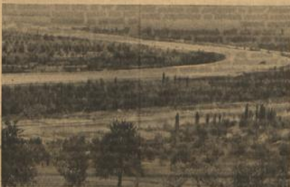
Mit 3,9 Millionen Mark werden die jährlichen landwirtschaftlichen Schäden durch die Grundwasserentziehung beim Bau des Rheinseitenkanals vermindert. Unser Bild, das den Kanal und das Flußbett des Oberrheins zeigt, wurde von einer Höhe des badischen Ufers aus gemacht.