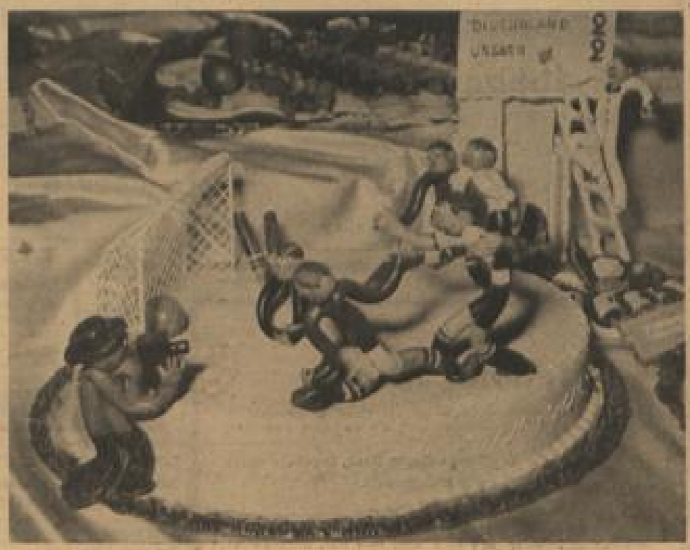
Fußball auf der Torte Als „Marzipan-Reporter“ brüllte sich ein genialer Konditor, der zur Internationalen Gastronomie- und Fremdenverkehrsausstellung in München diese Ausleihe-Szene aus dem Weltmeisterschaftsspiel Deutschland-Ungarn liebevoll zusammengesetzt hat. Auf einem Tortenboden sieht man die Akteure in ihrem bunten Dress, selbst der Fotograf, nach dessen Aufnahme der Konditor diese Szene nachbildete, ist nicht vergessen.