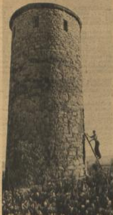
Hier steigt er ein

„Besuch aus dem Weltall!“ ist eine Sendung, so sei abschließend bemerkt, die „in der Luft lag“, die kommen mußte und die vielleicht ihren Teil dazu beiträgt, daß das Problem der fliegenden Untertassen mit mehr Objektivität und gehöriger Skepsis betrachtet wird.