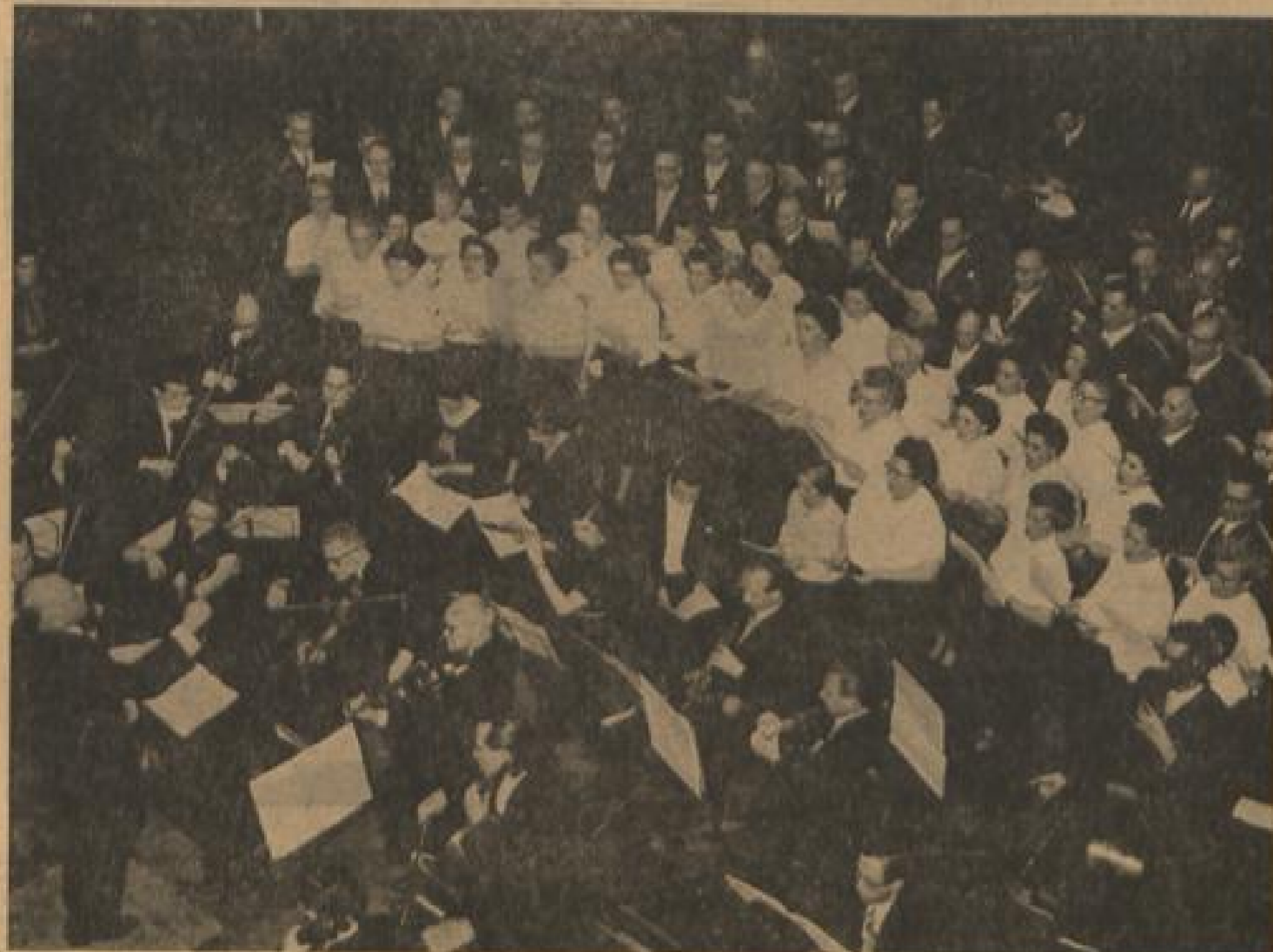
Der gemischte Chor der Constantia und das Kuppelfläche Kammerorchester wirken zusammen