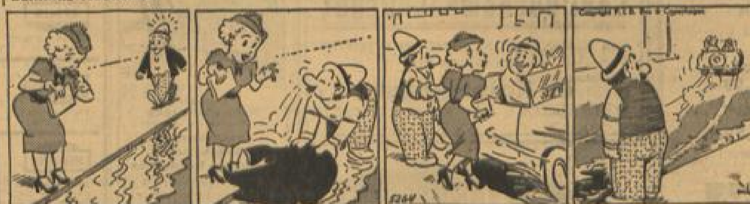
Bei schönen Damen so wie hier setzt man sich rasch als Kavaliere.