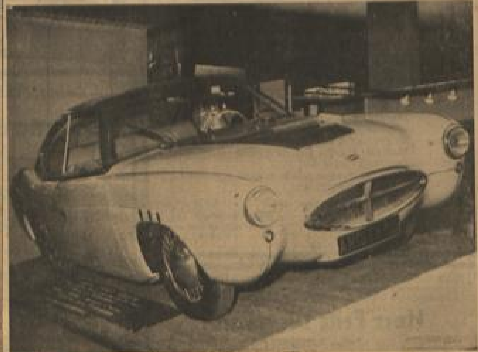
Einen Wagen aus Glas stellt Frankreich vor. Bald wird man auf den Straßen Autos sehen können, deren Karosserien aus hierfür besonders präpariertem Glas hergestellt ist und die Haltbarkeit von Stahl aufweist. Die Form des Wagens „Arista“ ist betont schlicht konstruiert. Unser Bild zeigt den neuen Wagen auf der Ausstellung im Salon der Chemis.