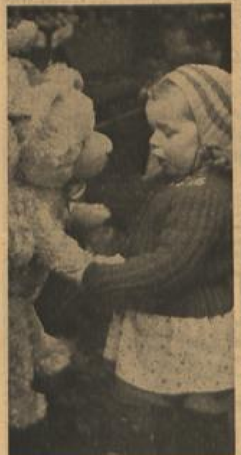
Der Teddy auf dem Weihnachtsmarkt scheint bereits die Entscheidung gebracht zu haben. Man geht wohl kaum fehl in der Annahme, daß der fast gleich große Bär auf dem Wunschzettel der kleinen Dame nicht fehlen wird.