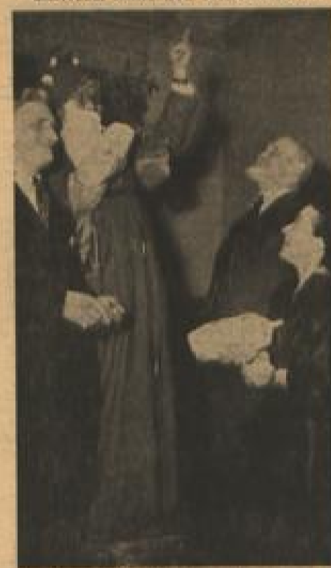
Die Zeit der Nikolausfeier beginnt — am Sonntagabend kam er zum „Liederkränzchen“ in die Bienenstraße.