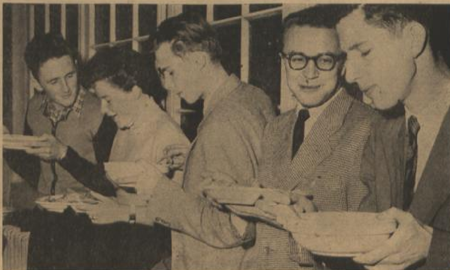
Man ist im Stehen — kein Platz in der Mensa

Im Jahre 1925 gab es in Heidelberg 1300 Studenten. Heute sind es mehr als 5000. Mit dieser raschen Zunahme der Studenten hat die Ausdehnung der Baulichkeiten keineswegs Schritt gehalten. In unserer Ausgabe vom letzten Freitag haben wir auf die drängenden Raumnotprobleme hingewiesen, die sich aus dieser Steigerung auf der einen und aus der Ueberalterung der Häuser auf der anderen Seite für die Heidelberger Universität ergeben. Heute machen wir unsere Leser mit einer Einrichtung bekannt, in der die beschränkten Raumverhältnisse nicht weniger augenfällig zutage treten als in Hörsaal und Seminar: der Mensa.