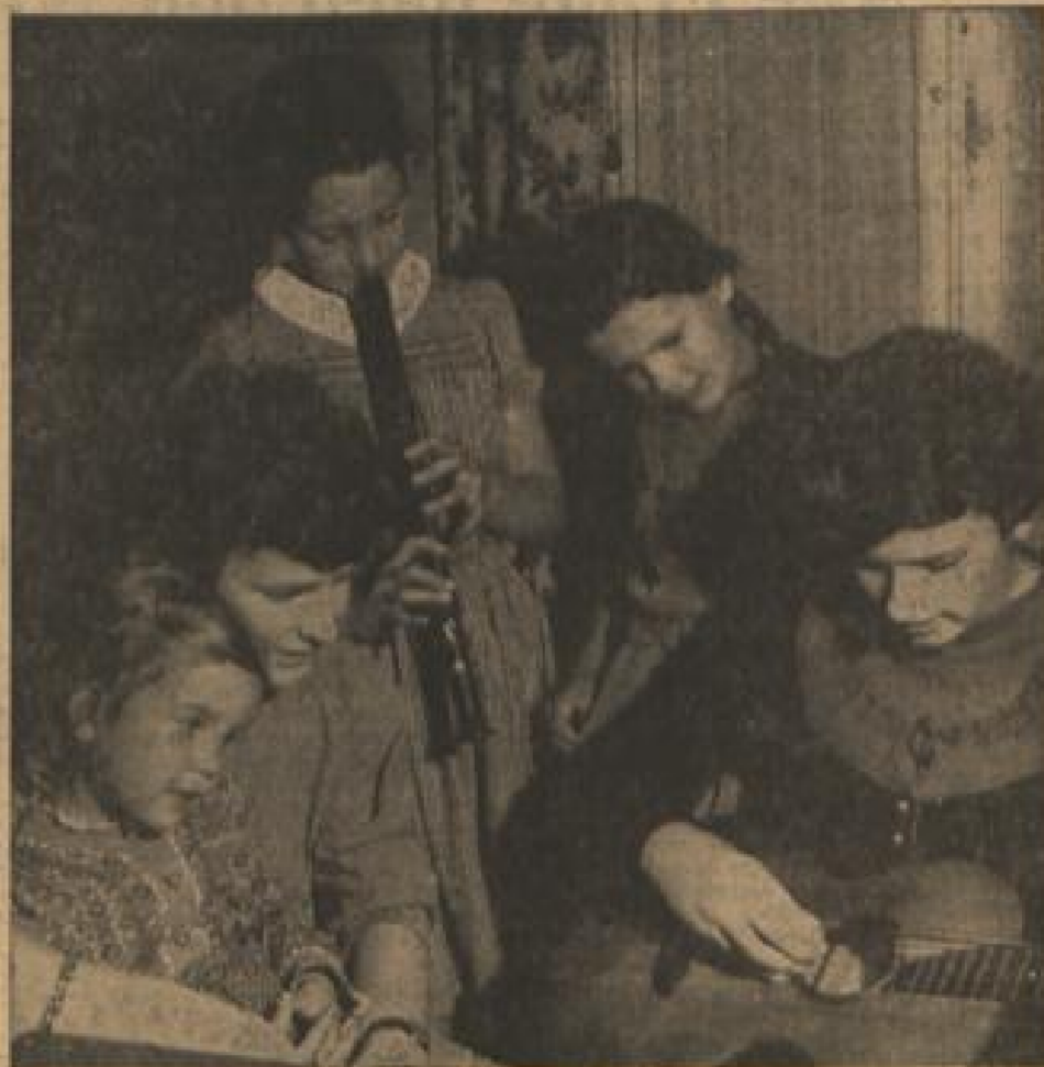
KLEINE NACHTMUSIK IM ADVENT

Hohe Kunst wird sich da wohl kaum vernahmen lassen. Artig und gewissenhaft setzt man ein Tüchlein hinter das andere. Aber die Zuhörer sind voller Andacht. Es ergeht ihnen wie dem Zuschauer, der auf leises Schloß davonschleicht und Blitz und Kamera um dieses anmutige Bild festzuhalten. Auch ihn rührt das Versprechen der jungen Geister, und auch sein Bild wirkt nicht durch großen Aufwand, sondern durch behutsames Mitempfinden.