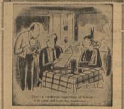
„Ein ausgezeichnete Vorschlag. Wir werden ihn im Auge behalten. Bringen Sie uns zwei Paar Würstchen.“