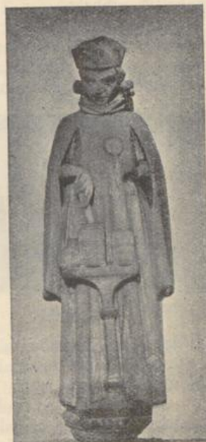
Abb. 4.