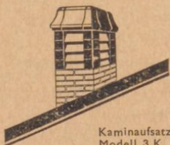
Kaminaufsatz Modell 3 K

Doppelkamin für Heizung, Gas und Lüftung