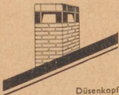
Düsenkopf Modell 12