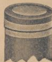
Nach der Sterilisierung 92

Einzige Packung mit selbsttätigem Verschluss im Sterilisierapparat