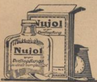
Regelmäßig wie ein Uhrwerk

gegen Obstipation Das ideale Darmgleitmittel