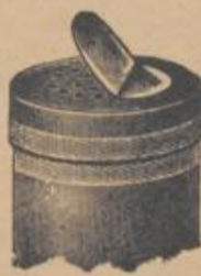
Vor der Sterilisierung