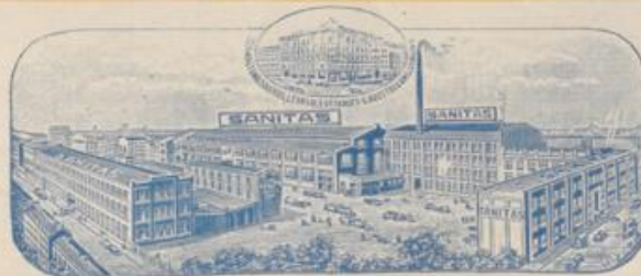
berliner Patrilkanlagen der „Sanitas“

Bremen, Breslau, Cassel, Dresden, Düsseldorf, Frankfurt a. Main, Hamburg, Hannover, Heidelberg, Köln, Königsberg i. Pr., Leipzig, Magdeburg, Mainz, Mannheim, München, Nürnberg, Rostock, Schwerin, Stefin, Stolp, Stuttgart.