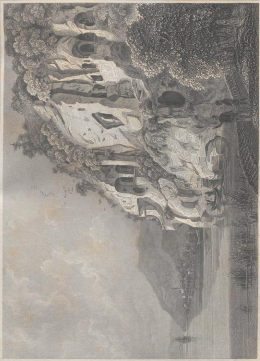
DIE HOCHSCHULEN DER HERRLICHEN UNIVERSITÄT WÜRZBURG