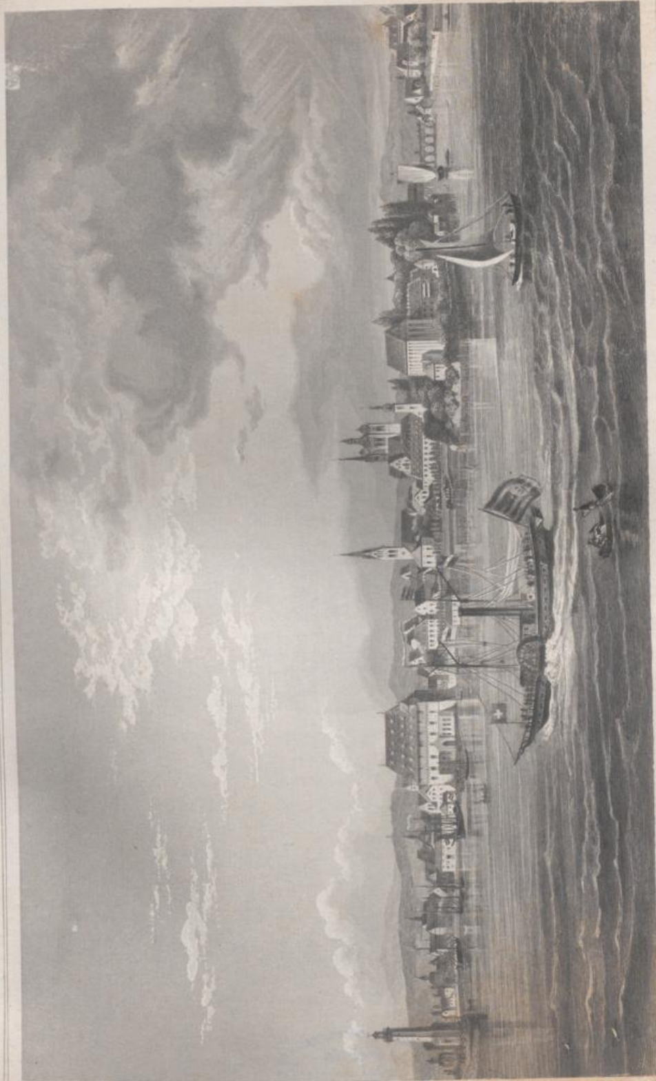
Abbildung von Konstanz