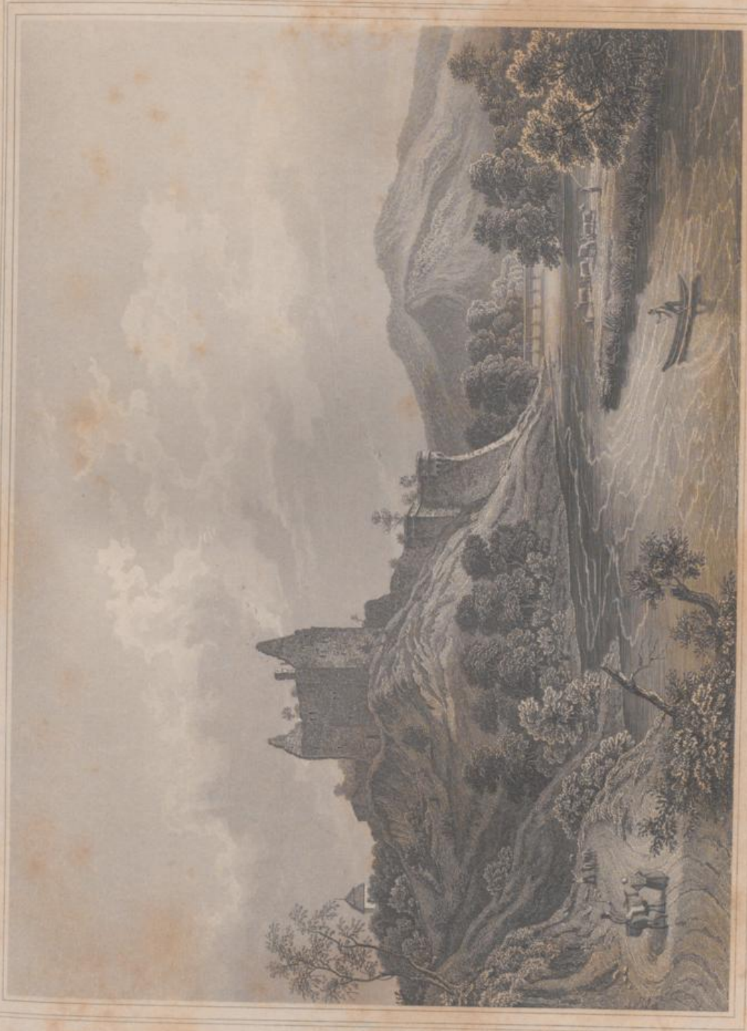
WURTEMBERG BEI BREUSACH