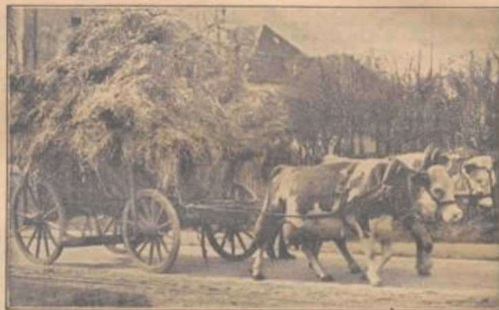
Hinterwälder Kuh und Bulle im schweren Zug

Diese angeführten Zahlen und Beispiele sollen darlegen, daß eine gute Veranlagung für hohe Milchleistung hier vorliegen mußte und durch entsprechende Fütterung und Haltung voll zur Entwicklung gelangte. Auch die anderen hier aufgestellten Hinterwälder zeigen sich in gleicher Weise sehr dank-