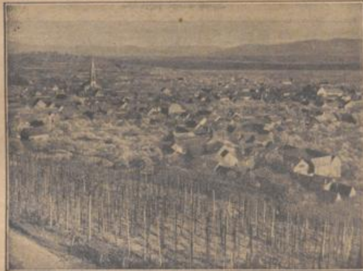
Das Winzerdorf Ihringen ist berühmt durch seine Weine

Wenn auch der Gescheinansatz ein guter ist, so muß doch bedacht werden, daß bis zur Reife noch zahlreiche Umstände eintreten können, welche die Aussichten vernichten. Vor allem sei