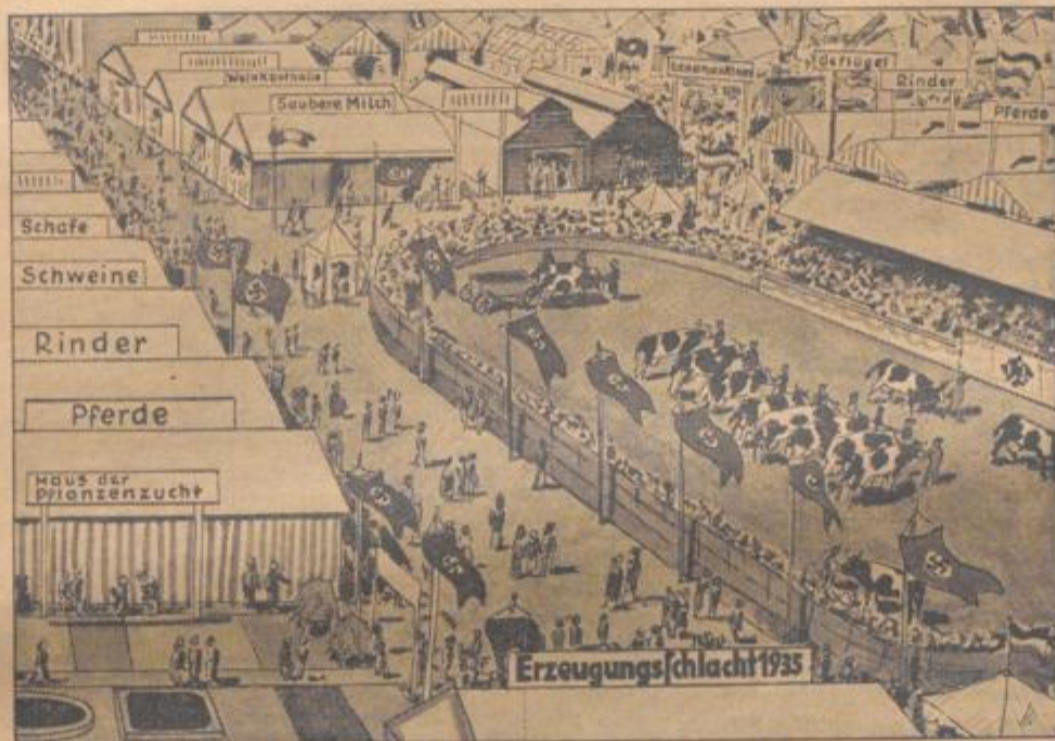
Mustergültig ist die Ordnung auf dem Ausstellungsgelände

An der Hauptstraße der Ausstellung finden wir das strohgedeckte Schwarzwaldhaus, in dem zwei schmutze Schwarzwälderinnen in Tracht, ein Renschtäler u. ein Gutacher Maidl