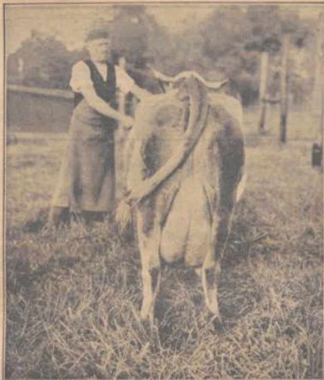
„Alba“ kurz nach dem Abkalben. Tagesleistung 22 Kilo Milch