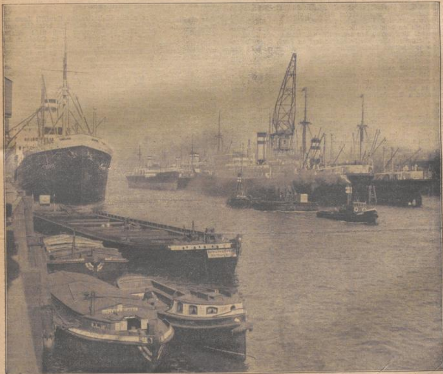
Im Hafen der Hamburg-Amerika-Linie