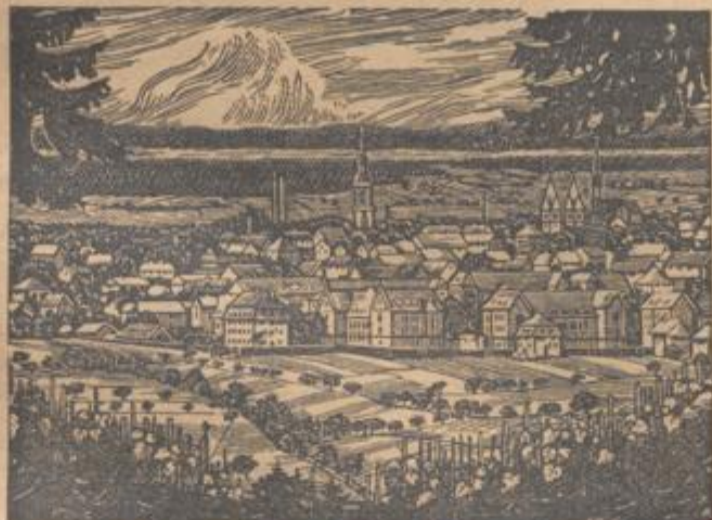
Offenburg, der Mittelpunkt der Ortenau

zeigt sich eine große Bilanzflüssigkeit. Von der 3,5 Mill. RM.