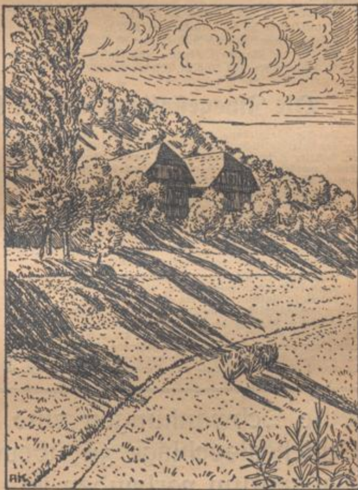
Erbbhof im Durbach-Gebirg

hat man es wie in diesem Jahr mit einer ausgeglichenen oder, was in nicht wenigen Gegenden des Reiches der Fall ist, sogar mit sehr reichlichen und gut eingebrachten Heuerträgen zu tun, so kann, ja muß überdies wiederum ohne Einschränkung das Ziel verfolgt werden, die Futterversorgung der Landwirtschaft