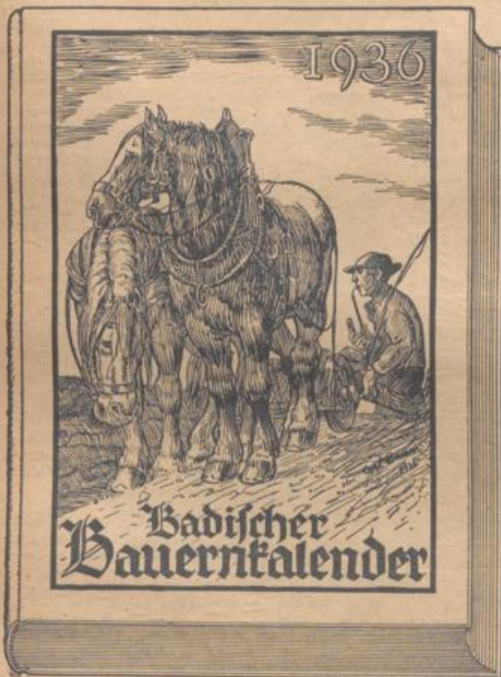
Bauern bestellt Euern Kalender!

Zum Verbrauch überbrüht man sie kurz, um Staub und Schmutzteilechen aufzulösen und zu entfernen. Dann weicht man sie in kaltem Wasser etwa 1—2 Stunden vor, um sie dann im selben Wasser, in dem wertvolle Stoffe schon gelöst sind, wie üblich zu kochen. Es ist anzuraten dazu, ein paar Stengel getrocknetes Bohnenkraut und einen Stengel getrocknetes Basilikum mitzukochen, der Geschmack dieser Bohnen ist dann ganz ausgezeichnet.