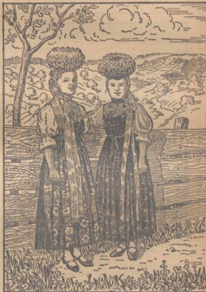
Trachten in Lehengericht

Größe Oberkohlraben von den großen Blättern befreien, die kleinen und Herzblätter gesondert abschneiden und kräftig überwellen lassen. Währenddessen die Kohlraben in Scheiben schneiden, und 4 Minuten vorkochen, fest in Dosen füllen, die abgekochten, grünen Blätter darauflegen, und mit abgekochtem Salzwasser auffüllen, verschließen; die 1-Kilo-Dose 1 1/2 Stunden, die 1/2-Kilo-Dose 2 Stunden kochen und abkühlen.