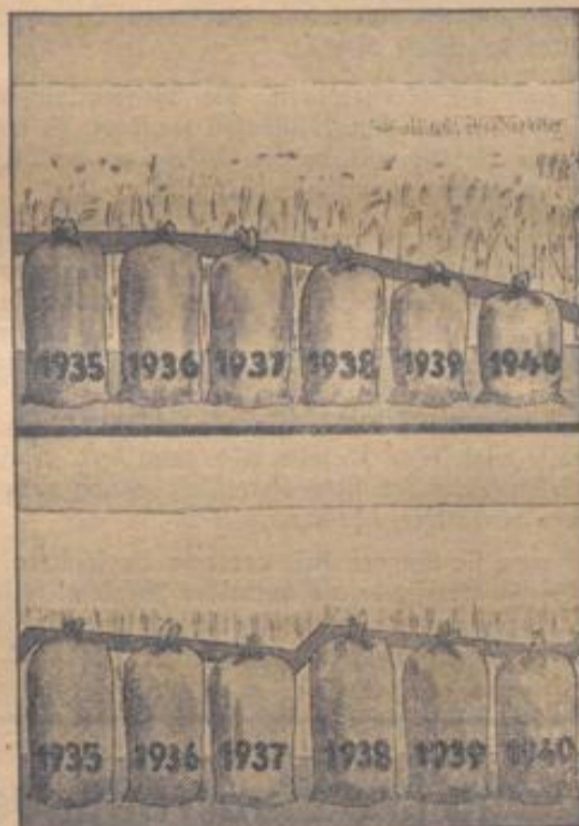
Bei ständiger Verwendung von Saat aus eigener Ernte gehen die Erträge stets zurück.

Ein weiterer sehr wichtiger Zweck wird noch verfolgt, nämlich die Demonstration neuzeitlicher Methoden in der Feldvorbereitung, der Düngung, der Ansaat sowie der Pflege der aufgelaufenen Bestände.