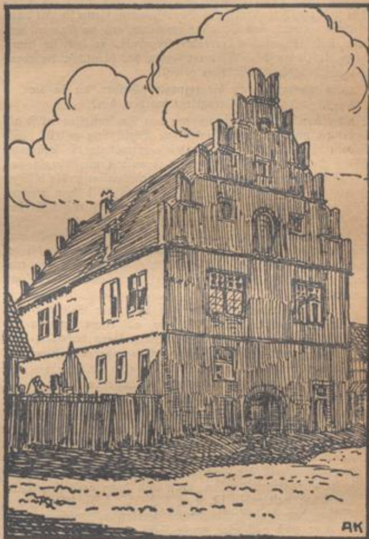
Alter Bauernhof in Schönfeld (Amt Tauberbischofsheim)