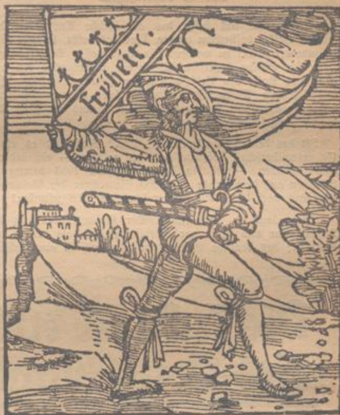
Zeitgenössisches Bild aus den Bauernkriegen