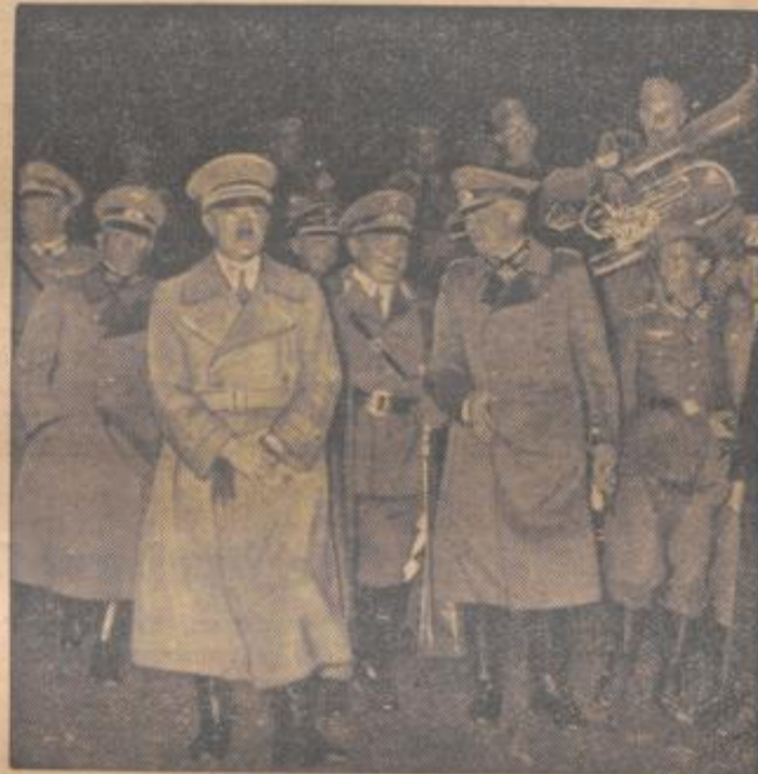
Der Führer bei der Wehrmacht

Nach der Weihe der Fahnen und Standarten, die der Führer vornahm, begann der große Vorbeimarsch. In endlosen Kolonnen marschierten die Stürme in musterergültiger