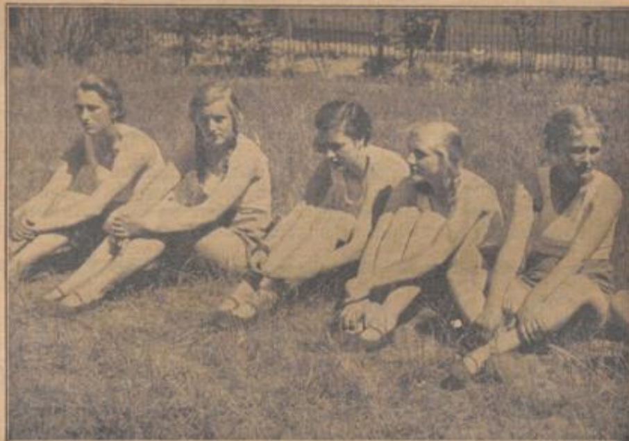
Bei einer Übungspause

Drei Mahlzeiten hatte man eingeführt, und wenn auch in der ersten Zeit manch einer gern noch die Einschaltung einer oder zweier weiterer Eßpausen gesehen hätte, so war auch diese