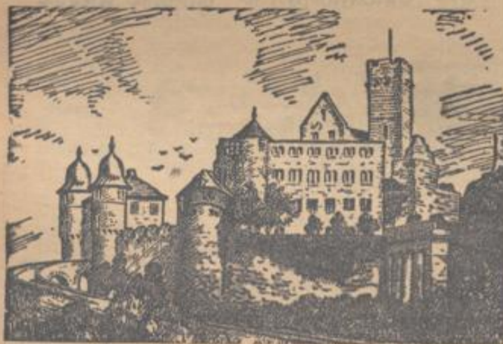
Schloßruine Bertheim am Main

Ist die Anmeldung des Wildschadens rechtzeitig erfolgt, so hat die Ortspolizeibehörde (Bürgermeister) zur Ermittlung des behaupteten Schadens und zur Herbeiführung einer gütlichen Einigung unverzüglich, einen Termin an Ort und Stelle anzuberaumen, zu dem die Beteiligten (Geschädigter, Jagdpächter und evtl. Zweitschuldner) unter dem Hinweis zu laden