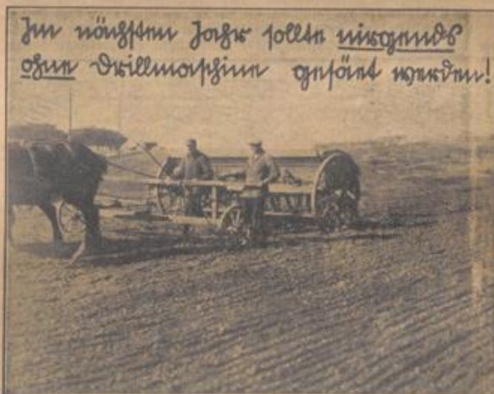
Diese Forderung der Erzeugungsschlacht sollte auch bei uns in Baden beherzigt werden

Die Forderung der Erzeugungsschlacht sollte auch bei uns in Baden beherzigt werden