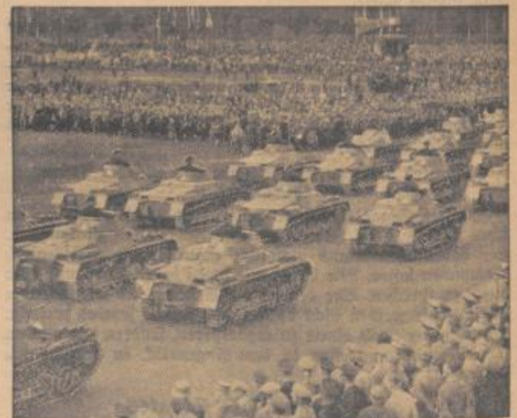
Das Jahr 1935 brachte uns die Wehrfreiheit

Wir werden aber vor allem die Bewegung als die Quelle unserer Kraft innerlich festigen und wir werden in ihrem Sinne fortfahren in der Erziehung der deutschen Menschen zu einer wirklichen Gemeinschaft.