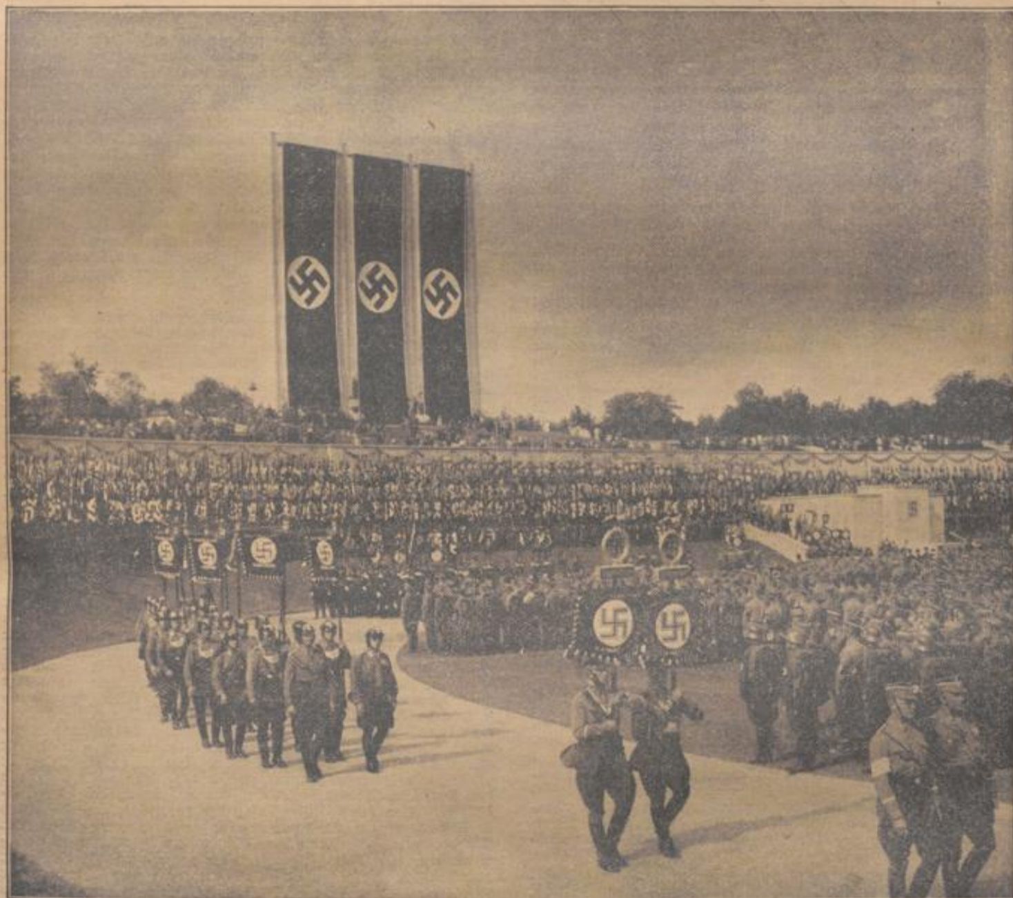
Der Reichsparteitag 1935

Karlsruhe, 20. Scheiding (September) 1935