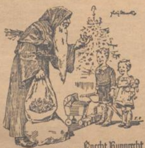
Knecht Rupprecht hängt für Groß und Klein Das Winterhilfswerk Reichsland Sammlung der B. J. v. 18-22. Dg. 35