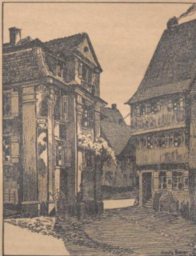
Das altertümliche Rossbach

(Von dem dunkelfarbigem Aussehen des Harns hat die Krankheit den Namen schwarze Harnwinde erhalten.) Mit Hilfe von an der Stalldecke befestigten Gurten muß versucht werden, das Tier in die Höhe zu bringen, muß es aber meistens bald wieder ablassen, weil es zu ersticken droht. Man macht eine hohe Streu und legt das Pferd alle zwei Stunden auf die andere Seite, außerdem versucht man, falls eine Besserung eintreten sollte, wieder das Tier in die Höhe zu bringen. Schon beim nächsten Umwenden zeigen sich die Hautstellen, auf denen das Pferd gelegen hat, an den Augenbogen, den Hüften, an den Schultern und an den Rippen aufgelegt, d. h. von Sa-