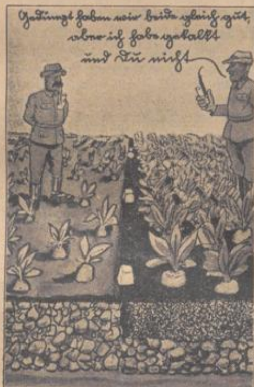
Der Kalkzustand des Bodens ist von ungeheurer Bedeutung für den Ertrag

Der gute Kulturboden soll im allgemeinen zum mindesten eine kleine Menge an kohlen saurem Kalk enthalten, damit die Pflanze, wenn nötig, aus diesem Vorrat schöpfen und die Bodenteilchen zur Erhaltung ihrer günstigen Struktur von ihm beliefert werden können. Die gleichzeitige Kenntnis über die Größe der verschiedenen Boden Säuren, zu denen die Austausch-säure und hydrolytische Säure als wichtigste gehören, sowie