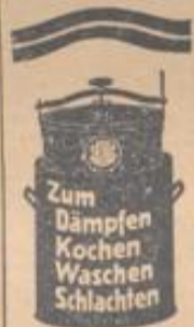
Zum Dämpfen Kochen Waschen Schlachten

mit Leinwand durch Flachsbau unter Ausnutzung der Reichszuschüsse Annahme von Flachs und Werg aller Art zur Lohnverarbeitung, zum Tausch geg. Gewebe, gegen bare Kasse. Auskunft bereitwilligst. Leinenspinnerei u. Weberei M. Drossbach & Co. Bäumenheim, Bayern