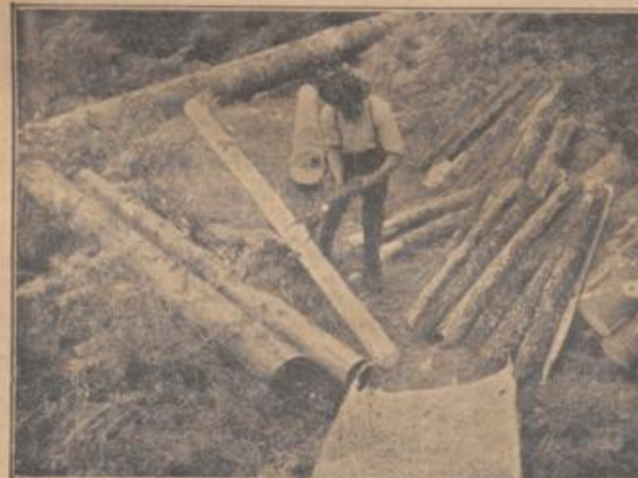
Das Entrinden der Stämme

Eine planmäßige Inangriffnahme der Abfallverwertung im Holzhandel und im Sägewerbe unterblieb bislang — von Ausnahmen abgesehen; hier eröffnet sich der Holz- und Sägewerksindustrie ein dankbares Arbeitsgebiet. An neuen Vorschlägen von Seiten der Technik fehlt es nicht: Verarbeitung der Holz-