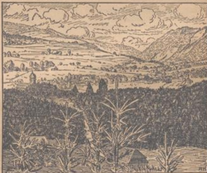
Das schöne Hintergarten

Die Entwicklung verbesserter und holzsparender Konstruktionen, die heute dem Techniker die Errichtung erstaunlich küh-