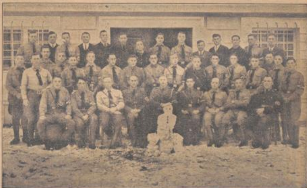
Die Kreisjugendwarte beim Schulungslehrgang in Scheidenhardt

Der Welt aber zeigt die junge Generation des Führers, daß sie in allem Tun und Denken bestrebt ist, sein Werk der friedlichen Arbeit zu fördern.