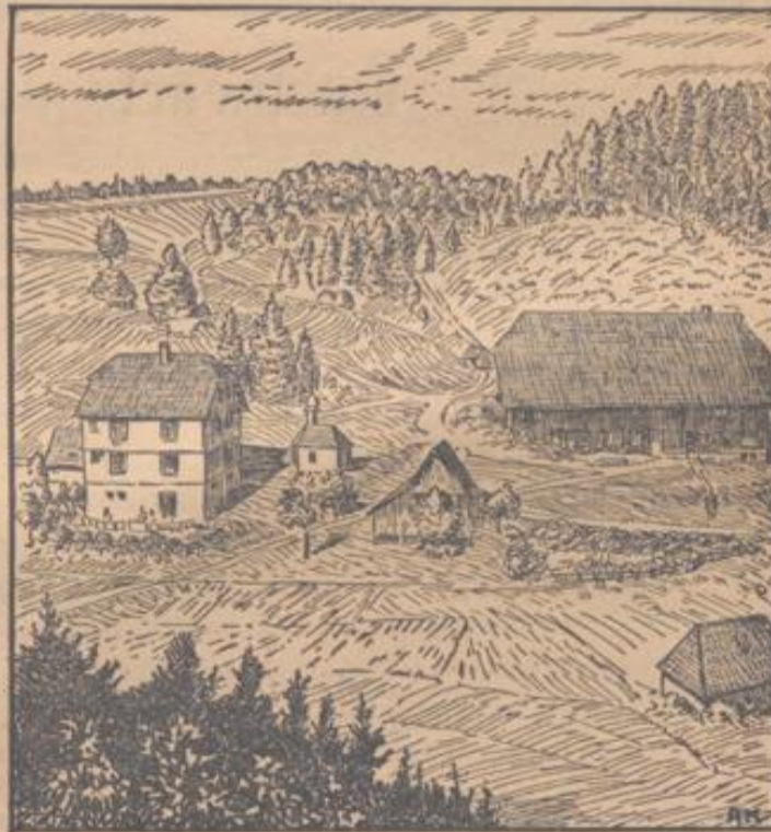
Bauernhof in Langenbach

Bisher war die Einschaltung der Badischen Landesfiedlung in solche Entschuldungs- und Zwangsversteigerungsverfahren nur ausnahmsweise möglich. Bei dem geringen Umfang der Flächen steht die dafür aufgewendete, umfangreiche, grundbuchtechnische, banktechnische und gesetzeskundliche Kleinarbeit in keinem Verhältnis zu den aufgewendeten Kosten. Der Siedlungspolitische Erfolg beansprucht hier einen unverhältnismäßig hohen Aufwand. Eine in Zukunft wünschenswerte stärkere Einschaltung hat die Lösung verschiedener organisatorischer Maßnahmen zur Voraussetzung, insbesondere handelt es sich um die Mitarbeit von geeigneten Sachverständigen in den Bezirken, um die einzelnen Verfahren von den örtlichen Stellen durchgearbeitet und geklärt an die Badische Landesfiedlung zur Vorlage bringen zu können.