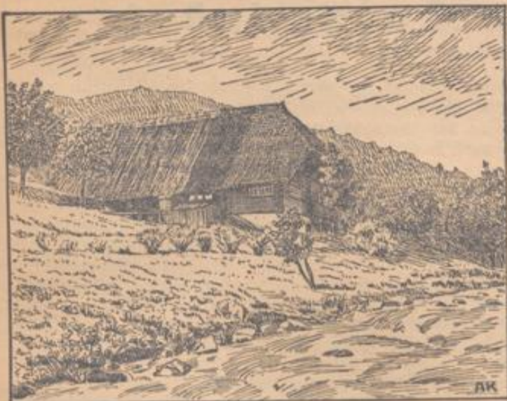
Der Knechtshof im Wolfstal

ren entblößt, blutig gefärbt und nässend. Die Schwäche nimmt immer mehr zu, das Pferd kann auch das Vorderbein nicht mehr erheben, zum Schlusse nicht einmal mehr den Kopf. Mit den Füßen macht es nur noch von Zeit zu Zeit schwimmende Bewegungen; am übernächsten Tage geht das Pferd ein.