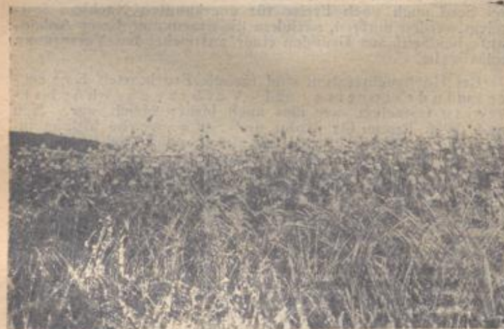
Ausgezeichneter Mohnbestand im Bauland. Im Vordergrund Sommergerste

Bauern und Landwirte, es muß möglich sein, mehr Oelfrüchte zu bauen, wenn es auch manchmal schwierig erscheint! Körner.