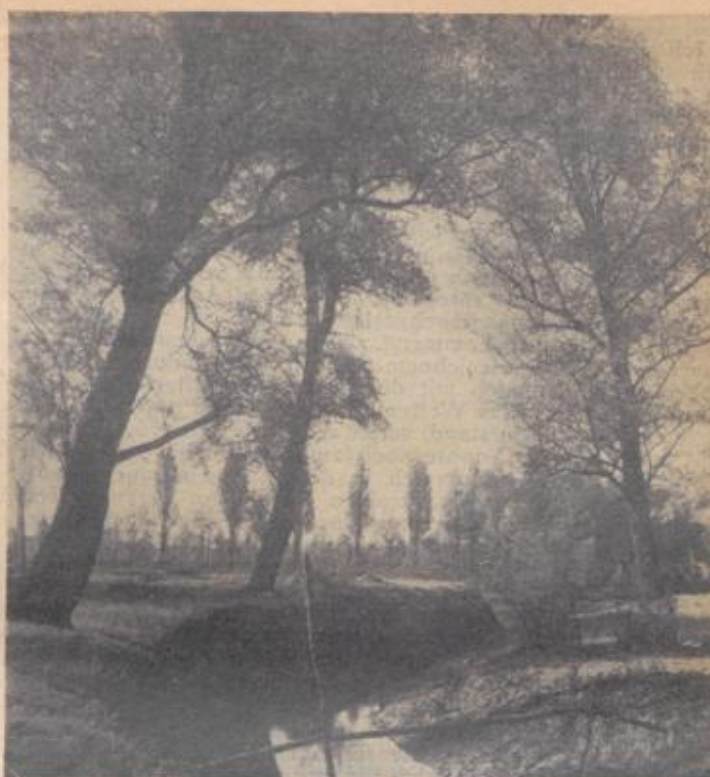
Die Rheinniederung bei Knielingen

In so mancher stillen Stunde sann ich auch über den großen Wald hinter meiner Hütte nach. Tag und Nacht ging ein Rauschen von ihm aus, das mich beseeligte. Dieses Rauschen wurde mit den Wochen zur Sprache, die ich immer besser verstand, je tiefer ich an Sonnentagen in diesen Wald eindrang. Da es darin keine Wege und Stege gab, schritt ich immer ganz langsam durch den Wald. Jeder Schritt brachte mir anderes. Wie oft fand ich hinter hohem Schilf unendlich