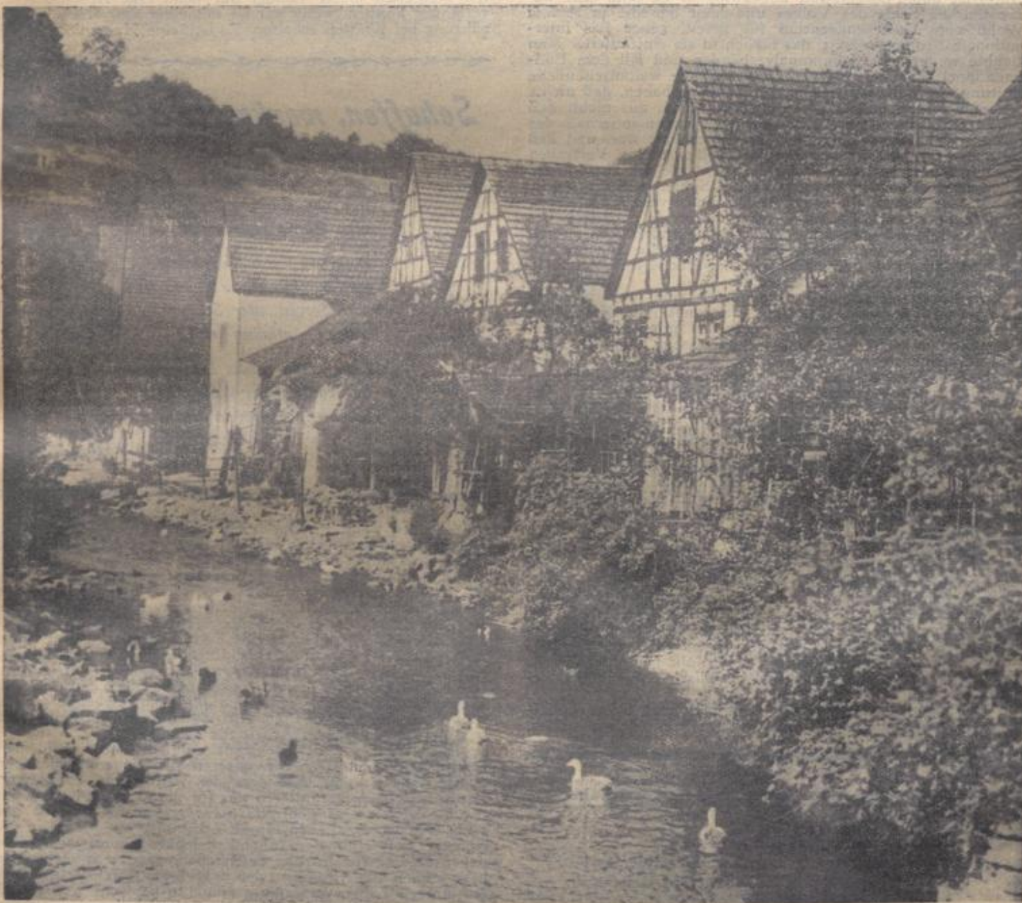
Allfeld im badischen Bauland