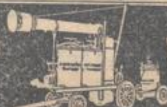
MODELL SACHSEN TAGESLEISTUNG 90-130 DZ.

Unsere Trümpfe! Sie können nicht vorteilhafter einsäuern, denn die hohen Tagesleistungen lassen sich bei sparsamstem Brennstoffverbrauch u. wenig Arbeitskräften m. Leichtigkeit erzielen. Die lange Lebensdauer der AMMERLAND-Dämpfkolonnen ist allgemein bekannt.