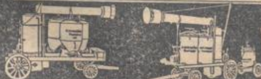
MODELL NIEDERSACHSEN DRR TAGESLEISTUNG 150 DZ.