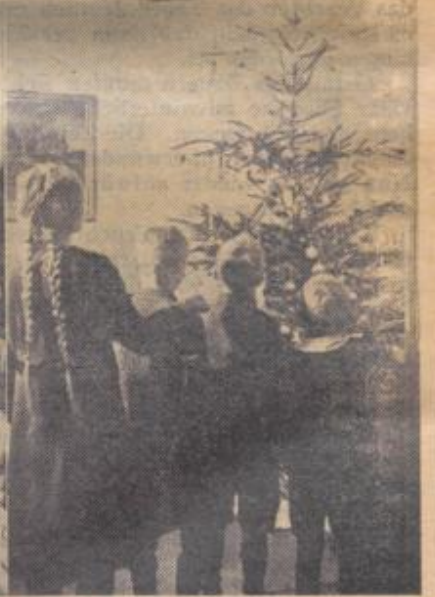
Die Weihnachtserzählung unter dem Lichterbaum. Aufn.: Schrammen-Schröder. — Die Weihnachtspost mit den Geschenken, die schon längst an Bord eingetroffen ist und bis zum Weihnachtsabend aufbewahrt wurde, wird nun voll freudiger Erwartung ausgepackt. Aufn.: PK-Wagner-Schörl. — Die Tür geht auf und vor den Kindern steht im leuchtenden Schmuck der Weihnachtsbaum. Aufn.: Möbbauer-Schröder.