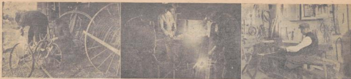
Das gesamte Rüstzeug jetzt durchsehen und pflegen. — Keine Instandsetzung länger aufschieben. — Nicht ruhen, bis die letzten Betriebsmängel beseitigt sind

der Mähmaschine. Der Fachmann kann einen sauberen Schnitt, eine befriedigende Leichtzügigkeit und Betriebssicherheit auch bei älteren Bauarten wieder herstellen. In unseren bäuerlichen Betrieben ist die Benützungszeit der Erntemaschinen sehr nieder. Grasmäher, Heuwender, Mähbinder, Kartoffelroder müssen hier 25 Jahre und länger vollständig zufriedenstellende Arbeit leisten, ohne daß anormale Instandsetzungen notwendig werden. Dies trifft auch für unsere Großmaschinen zu. Der Zustand der Dreschtrommel und des Dreschkorbes ist bei den Dreschmaschinen an erster Stelle zu prüfen, da diese Teile für die Ausdruschgüte entscheidend sind. Nicht jedes Jahr ist das Getreide so leicht dreschbar, wie im vergangenen. Schon nach 2—300 Dreschstunden werden von gutgeführten Dreschbetrieben die Schlagleisten regelmäßig erneuert und der Korb zurechtgerichtet. Wegen den zahlreichen Verschleißstellen müssen die Dreschsätze Jahr für Jahr vom Fachmann überprüft werden. Auch die Schlepper sind dem Fachmann ausnahmslos vorzuführen. Nur durch diese Nachprüfungen seitens eines erfahrenen Fachschlossers schützt man sich vor dem Maschinenausfall. Leider waren infolge der Einberufungen schon allzu oft unausgebildete, unerfahrene und halbwegsige Kräfte als Maschinenführer zu verwenden. Wo ausgebildete Maschinenführer fehlten, sind selbst bei geringen Jahresbenutzungstunden fachkundige Kontrollen in der Reparaturwerkstätte unumgänglich.