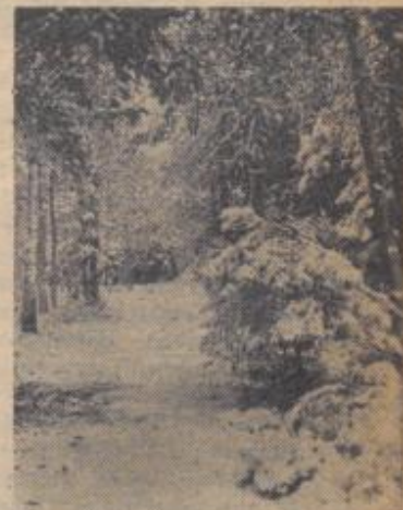
Verschnett sind die Hardtwälder

Im dinarischen Küstenlande des Adriatischen Meeres holt ein Mädchen am Morgen des 24. Dezember einen Armvoll Immergrün, achtet sorgfältig darauf, daß sie mit dem rechten Fuße über die Hausschwelle tritt, und dann schmückt sie mit kleinen Zweigen alle Räume des Gehöftes, auch Speisekammer und Flur, selbst Ställe und