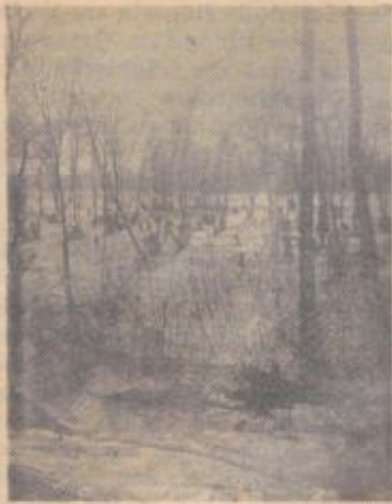
Die Sonne geht unter