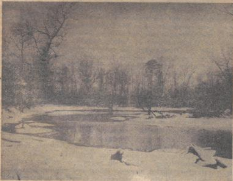
Die vielen Wasser in der Rheinebene träumen