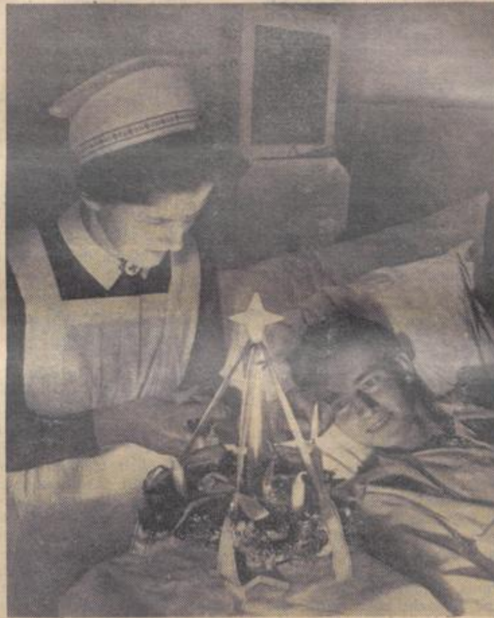
In liebevoller Obhut der Heimat genießt der Verwundete den strahlenden Lichterglanz.

Eine hoch, achtergeschmückte Tanne steht in der Ecke des Saales. Ja richtig, es ist doch Weihnachtszeit. Das ist den Grenadiere alles so unwirklich, da sie direkt aus den Schlacht- und Eisfeldern von Rußland kommen. In den Bunkern, Erdlöchern, Schneehöhlen, in den Kellern der zerschossenen Elendshütten mußte man die mageren Kerzenstumpen sparen. Und nun das viele, weiße, helle