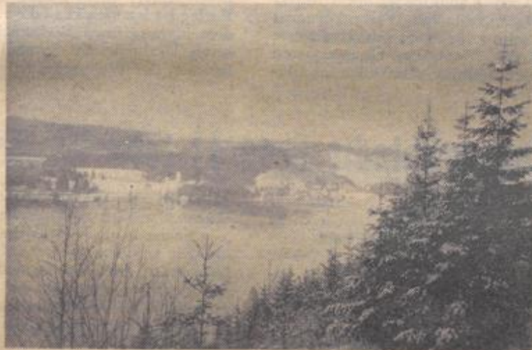
So sieht es jetzt in den Schwarzwaldbergen aus

Wichtiger für die Kenntnis völkischer Urheimatsgebiete als geographische Grenzen, die im Laufe der Jahrhunderte mancherlei Veränderungen unterworfen sind, ist die Feststellbarkeit volkstümlicher Eigenheiten. Mit treuer Liebe und in zäher Lebenskraft hegt ein seelisch gesundes Volk sie auch in Zeiten der Absperrung von verwandten Stämmen und deutet damit schlicht, aber unwiderleglich auf die volkliche oder rassische Zugehörigkeit hin. Beispiele hierfür bieten zahlreiche Weihnachtsbräuche, die sich trotz politischer Verschüttung des Deutschtums in Gauen erhielten, deren Herrschaft sich im Laufe einer wechselvollen Geschichte vorübergehend zur Macht gekommenen Nachbarvölker angemaßt haben; an dererseits aber deuten auch manche Julsitten, die diesseits und jenseits der Reichsgrenzen geübt wurden, deutlich darauf hin, daß Stammesverwandtschaften über politische Trennung hinweg bestehen blieben; und schließlich offenbart sich in der Parallelität volkstümlicher Bräuche nicht selten auch die Gemeinsamkeit der geistigen Grundhaltung, die allen arischen Völkern irgendwie gemeinsam ist und somit den heute