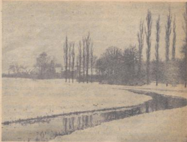
Rheinniederungsdorf am ersten Weihnachtstag

im Vordergrund des Geschehens stehenden Wunsch nach einer europäischen Zusammengehörigkeit sachlich begründet.