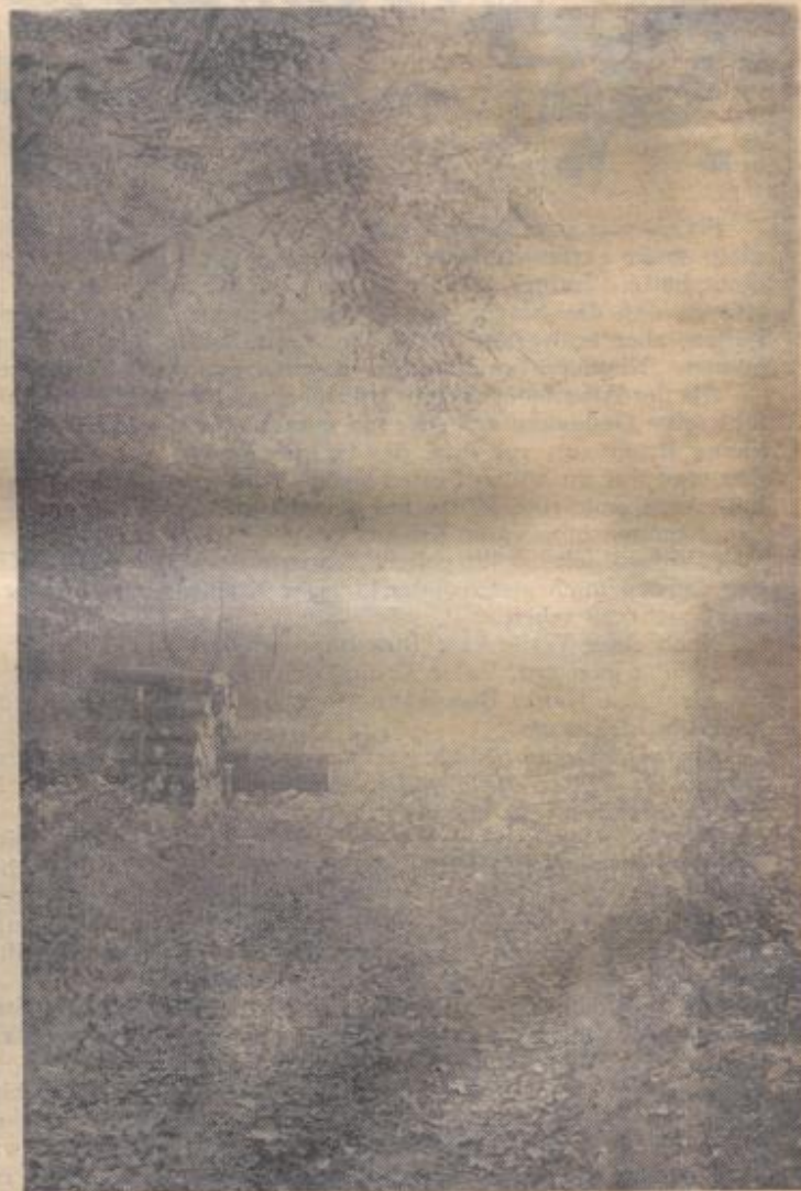
Und Nebel legten sich am Weihnachtsvorabend über den Wald

Salatplatte: Zu der großen Salatplatte gehört außer dem Kartoffelsalat auch Sauerkrautsalat (rohes Sauerkraut mit feingewiegten Äpfeln vermischt) und ein pikanter, gemischter Salat aus Kartoffeln, Sellerie, roten Rüben, Äpfeln und Gurken.