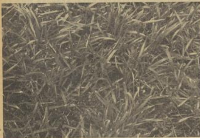
Stark mit Vogelweide verunkrauteter Wintergetreidebestand im Frühjahr. Wenn rechtzeitig eegget worden wäre, dann würde das Unkraut vernichtet sein.

Der erste Eggenstrich kann drei bis vier Tage nach der Saat gegeben werden. Das ist für die Unkrautbekämpfung sehr wertvoll. Dann aber muß Ruhe auf dem Acker herrschen, bis die Saat spißt. Dann kann der zweite Eggenstrich erfolgen, aber möglichst mit leichteren Eggen und mit der Reihe ziehend. Wichtig ist, daß dieser zweite Eggenstrich möglichst flach erfolgt, um die Wurzelbildung nicht zu stören. Der Unkrautriegel schafft hier gute und saubere Arbeit. Ein weiterer, sehr wertvoller Eggenstrich erfolgt dann nach Bildung des dritten und vierten Blattes; aber ja nicht früher eagen, lieber etwas länger zuwarten! Dieser dritte Eggenstrich ist so wertvoll wie ein warmer Wachregen und wirkt Wunder in der Weiterentwicklung der jungen Sommersaaten. Wir müssen noch viel mehr darauf achten, daß es uns gelingt, die Sommersaaten zu einer raschen Jugendentwicklung zu bringen, um eine kräftige, blattreiche Pflanze zu erzielen, die möglichst bald den Boden beschattet, um mitzuhelfen, Feuchtigkeit und Bodengare zu erhalten, eine hochwichtige Maßnahme, die wir noch nicht genügend in ihrer Bedeutung für gute Ernten einschätzen! Sommerung kann bis zur guten Sandhöhe eegget und ackriegelt werden. Durch Schrääeggen zu den Drillreihen treffen wir auch das Unkraut in den Reihen und lockern den Boden. Dabei ist schnelles Arbeiten von Vorteil. In ardueren Höhen sind zweckmäßigerweise breite Arbeitsgeräte im Wechsel von Anspannung und Menschen einzusetzen, um an einem Tag möglichst