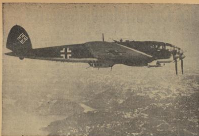
Die deutsche Luftwaffe beherrscht und schützt den norwegischen Luftraum. Unser Bild zeigt ein deutsches Kampfflugzeug über Norwegen