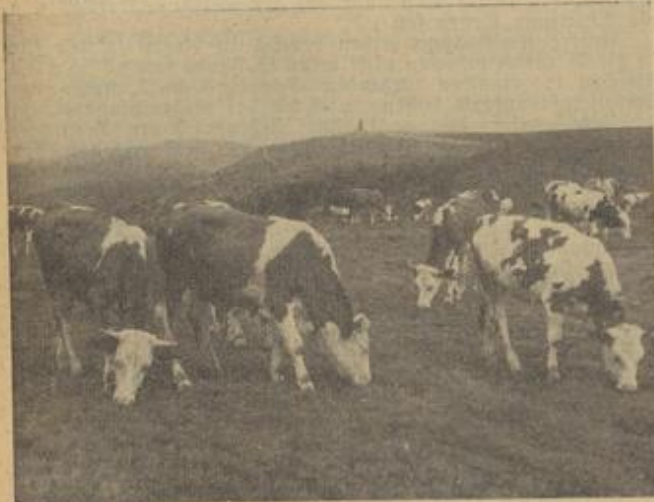
Jungvieh auf der Weide im Hochschwarzwald (Heldberg).

Wenn auch diese Art nicht alle Vorteile des freien Weideganges hat, so dürfte sie gerade in unseren badiischen Verhältnissen, wo es meist an Koppelweiden fehlt, mehr Beachtung verdienen als bisher, zumal das tägliche und zeitraubende Futterholen wegfällt.