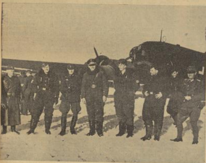
Soldaten der deutschen Luftwaffe nach der Landung auf einem norwegischen Flugplatz, auf dem noch Schnee liegt. Der dritte von links ist ein norwegischer Offizier von der Besatzung des Flughafens