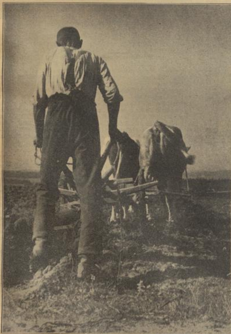
Der Altbauer bei der Frühjahrsbestellung