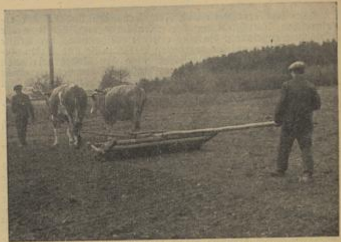
Durch diese Holz-Glatt-Walze wird die an sich richtige Krümmenstruktur des Aders völlig zerstört. Dieses Gerät gehört in eine Sammlung, aber nicht auf den Acker. Sie ist der Tod der Bodenfeuchtigkeit, besonders auf leichtem Boden.

Zum Brechen der Bodenkruste sind Stern- und Stachelwalze vorzüglich geeignet und leider viel zu wenig eingesetzt. In vielen Fällen werden wir erst ein Brechen der Verkrustung vornehmen müssen, ehe wir mit der Egge — Nebegge — Unkrautriegel — erfolgreich arbeiten können. Versuchen wir, mit der Egge die Verkrustung zu zerstören, laufen wir Gefahr, daß ganze Platten und auch Jungpflanzen herausgerissen werden. Dagegen können wir nach der rauhen Walze gleich eine nicht allzu schwere, vielsichtige Egge einsetzen, um die notwendige Auflockerung zu erreichen. Die Nebegge wird dabei wohl die beste Arbeit leisten, da sich die beweglichen Glieder gut dem Boden anpassen und richtig angreifen. Dabei werden eine Reihe von Unkrautern empfindlich getroffen und vernichtet. Das bekannte und bei normalen Verhältnissen gutbewährte „scharfe Eggen“ des Winterweizens muß in diesem Frühjahr mit großer Vorsicht und Sachkenntnis ausgeführt werden, wobei sich die „Schärfe des Eggens“ nach dem Stand der Pflanzen zu richten hat. Wer glaubt, durch scharfes Eggen vorgehen zu müssen, der kann