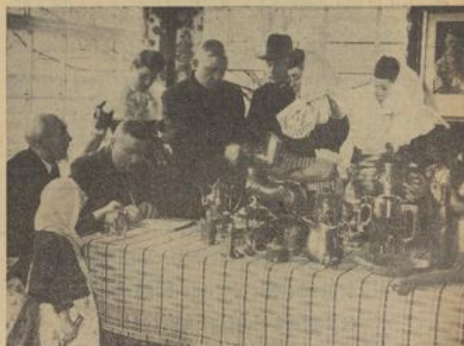
(Schel-Winterdienst) Generalfeldmarschall Hermann Göring konnte dem Führer am 20. April als Gewürzkräuterproduzent das gewaltige Ergebnis der Metallende des deutschen Volkes melden, an dem das Landvolk einen großen Anteil hat

Die nasse Witterung des letzten Sommers hat die Vermehrung der Stachmüden sehr begünstigt und die Herbstwitterung hat ein übriges getan, um der Ausbreitung der Mücken Vorschub zu leisten. Um einer Mückenplage in diesem Sommer vorzubeugen, ist daher die energische Bekämpfung dieser lästigen Tierchen unbedingt erforderlich. Von der Vernichtung von Gift und dem Ausräuchern durch Gase ist aus verständlichen Gründen abzuraten. Die einzige Räuchermethode, die empfohlen werden kann, und die auch einen vollen Erfolg verspricht, ist folgende: Man besorgt sich Räuchertabletten, wie sie zur Vernichtung gärtnerischer Schädlinge gebraucht werden. Zur Vergasung der Tabletten bedient man sich besonderer Dämpfchen. Man nimmt das Räuchern am besten abends vor, damit die Dämpfe nachts über einwirken können. Um ganz sicher zu gehen, wird das Räuchern an zwei aufeinanderfolgenden Tagen vorgenommen.