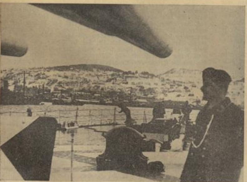
Bild von Bord eines deutschen Kriegsschiffes auf die norwegische Küstenstadt Trondheim