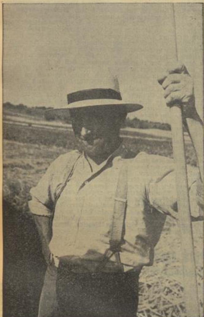
Wöllshäimer Bauer bei der Getreideernte

Kraftvolles, aleman. Bauerntum behauptet sich