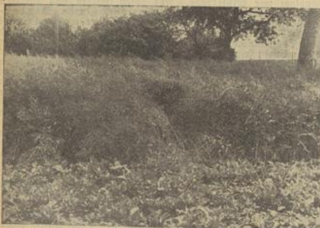
Erfolgreicher Anbau von Winterrapis, trotz des strengen Winters 1939/40 auf der Bodensberger Gemarkung

Daß nach Möglichkeit trotz dieser zusätzlichen Kulturarten wie Winterfrüchte, überwinterten Zwischenfrüchten und Wintergerste noch genügend Land für Winterroggen und