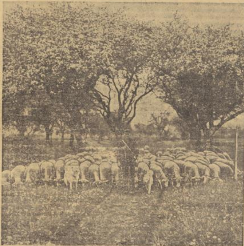
Osterzeit — Blütezeit

So dürfen wir an diesem Osterfest, das inmitten des härtesten Daseinskampfes unserer Nation begangen wird, in ganz besonderem Maße die tröstliche Gewißheit haben, daß, wenn dieser Kampf bestanden ist, eine um so fruchtbarere und gesegnetere Zeit des Wachsens und Blühens folgen wird, als die einst oft irreführende deutsche Volkskraft zum erstenmal auf unserem eigenen Felde nutzbar wird. Es wird dann die Zeit der Ernte folgen, die um so reicher sein wird, je größer die Opfer heute noch sein müssen. In dieser Ernte werden diejenigen Kräfte wiederkehren und österliche Auferstehung finden, die sich heute opferten in dem Bewußtsein, daß alles Große mit kampfreichen Opfern erkauft werden muß. F. L.