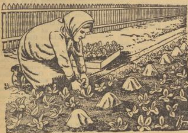
Zwischenkultur auf einem Gurkenbeet

Demnächst werden wir uns dann nach den bestellten Kohlrabi- und Kohljungpflanzen umsehen müssen, um die Zeit der Abholung mit der Stelle, die sie liefert, zu vereinbaren. Die Kohlsorten können alle zu gleicher Zeit gepflanzt werden, nur für Frühwirsing und Kohlrabi können noch einmal im Juni oder Juli Pflanzen bestellt werden während Grünkohl je überhaupt erst dann gepflanzt wird, und zwar am besten als Nachkultur nach abgeernteten Frühgemüsen, -kartoffeln oder auch abgeernteten Erdbeeren. Hinsichtlich der Pflanz-