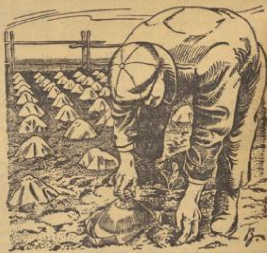
Witterungsschutzhauben werden verankert

Immer noch nicht bekannt. Es sei deshalb besonders auf ihn hingewiesen. Die Blätter lassen sich als Spinat, die Blattstiele als Stielgemüse zubereiten. Da die Pflanzen nach und nach immer wieder abgeblattet werden können — ähnlich wie es mitunter bei den Rüben geschieht wird —, so handelt es sich um ein Gemüse, das lange Zeit hindurch geerntet werden kann. Gerade im Sommer, wenn der Spinat so schnell in Samen schießt, ist es gerade auf dem Lande besonders angenehm, zwischendurch brauchbaren Ersatz zu haben. Bei dieser Gelegenheit sei gleich noch auf eine andere Pflanze hingewiesen, bei der ebenfalls eine Dauernutzung möglich ist. Es ist der Pfücksalat. Ein zarter Kopfkohl schmeckt allerdings besser. Dafür ist der Pfücksalat aber außerdem noch eine ertragreiche Grünfütterquelle für unser Junggeflügel. Wenn es ihn