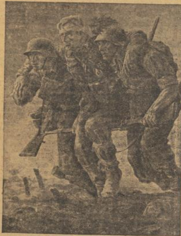
„Kameraden“, Ölgemälde von Richard Rudolph Die Welt des Soldaten auf der Großen Deutschen Kunstausstellung 1943 in München

An den Fronten aber stehen die Soldaten der wertvollen und schöpferischen Völker und Menschheitsrassen, um die Diktaturpläne der jüdischen Parasiten und ihrer Handlanger abzuwehren. Neben den blonden Söhnen Germaniens stehen die dunkellockigen Nachkommen des alten römischen Imperiums und mehr und mehr die Freiwilligen selbst der östlichen Gebiete Europas, um die Verstepfung abzuwehren, die aus dem Osten vordringen will. Un' fern in Ostasien stehen die jungen Söhne des uralten Sonnenbauers Nippons, um das Lebensrecht ihrer Rasse und den asiatischen Kontinent vor der Raubgier der jüdischen Ausbeuter zu schützen und neuzuformen. Die Ausbeuter der Weltwirtschaft hatten fremde Lebensräume und Rohstoffquellen der Erde zusammengestohlen, nicht um sie für die Menschheit zu nutzen, sondern um sie ihr vorzuenthalten. Während auf den Feldern Europas fleißige Bauernhände Brot fürs Volksganze schaffen, lassen die jüdischen Ausbeuter weite Erdgebiete brachliegen; sie lassen wertvolle Ernten verkommen und vernichten, um einer-