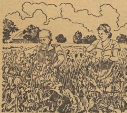
3 Zeichnungen Burgfeldt, nach Aufnahmen des RNSL.