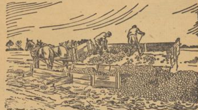
5 Zeichnungen: Burgfeldt, nach Aufnahmen: HNSL (2), Dr. Huhmann (2)