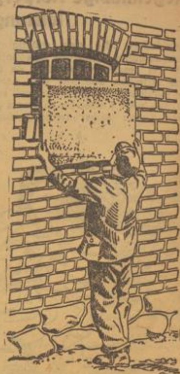
Zeichnung: Burgfeldt, nach Aufnahme des RNSL

Kartoffel verladen! Der Winterbedarf der Städte an Eßkartoffeln ist noch nicht ausreichend gedeckt. An frostfreien Tagen ist daher die Verladung von Eßkartoffeln nach Möglichkeit zu fördern.