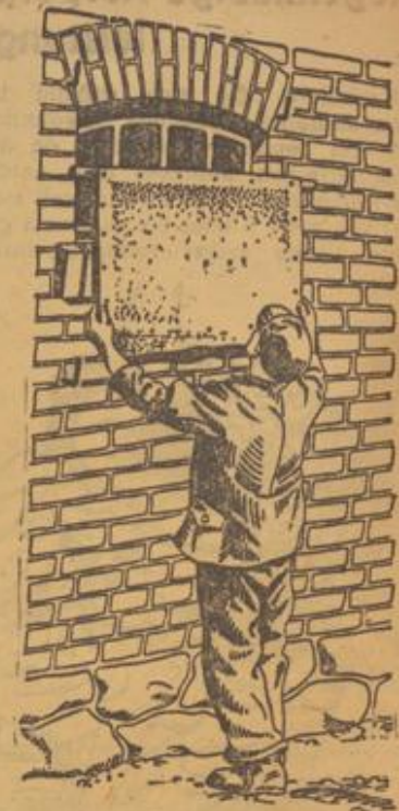
Zeichnung: Burgfeldt, nach Aufnahme des RNSt

Kartoffel verladen! Der Winterbedarf der Städte an Eßkartoffeln ist noch nicht ausreichend gedeckt. An frostfreien Tagen ist daher die Verladung von Eßkartoffeln nach Möglichkeit zu fördern.