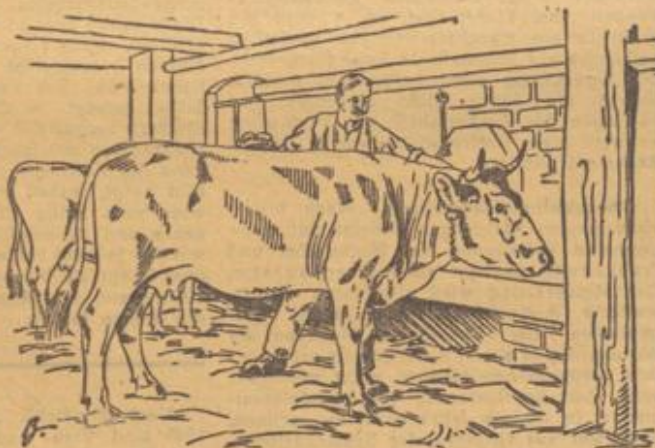
Gute Pflege gibt glattes Vieh

Reinigung wird gleichzeitig eine wirksame Massage der Haut ausgeübt, die die Blutzirkulation anregt und dadurch eine günstige hygienische Wirkung auslöst. Die Haut ist bekanntlich ein lebenswichtiges Ausscheidungsorgan für schädliche Stoffe, die mit dem Schweiß durch die zahlreich über die Haut verteilten Poren ausgeschieden werden. Diese Art der Funktion der Haut wird als Hautatmung bezeichnet. Eine weitere wichtige Aufgabe kommt der Haut als Wärmeausgleichsorgan zu, da bei hoher Außentemperatur eine Erweiterung der Blutgefäße der Haut und damit eine vermehrte Wärmeabgabe aus dem Körperinnern, bei niedriger Außentemperatur eine Verengung der Gefäße und demzufolge eine Zurückhaltung der Körperwärme bewirkt wird. Die Hautpflege muß demnach darauf gerichtet sein, durch eine regelmäßige Reinigung und