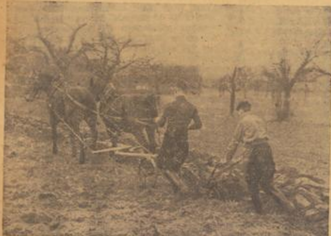
Reichsberufswettkampf, Gruppe Nährstand, Gauentscheid Prüfungsaufgabe: Pflüge Stallmist unter zum Kartoffelsetzen

Niemand in der Heimat ist der Front verbundener als der schaffende Mensch. Melde dich daher zum Kriegsberufswettkampf 1943/44!