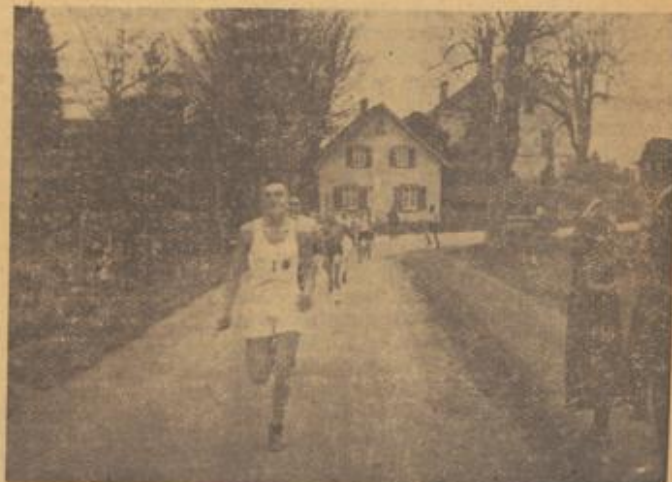
Reichsberufswettkampf Gruppe Nährstand Kreisentscheid beim 300-Meter-Lauf