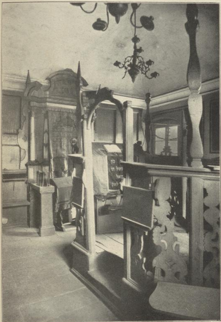
Synagoge im Rabbinatshause in Bruchsal. (Errichtet vom Hofjuden Süßel in der 1. Hälfte des 18. Jahrhunderts.)