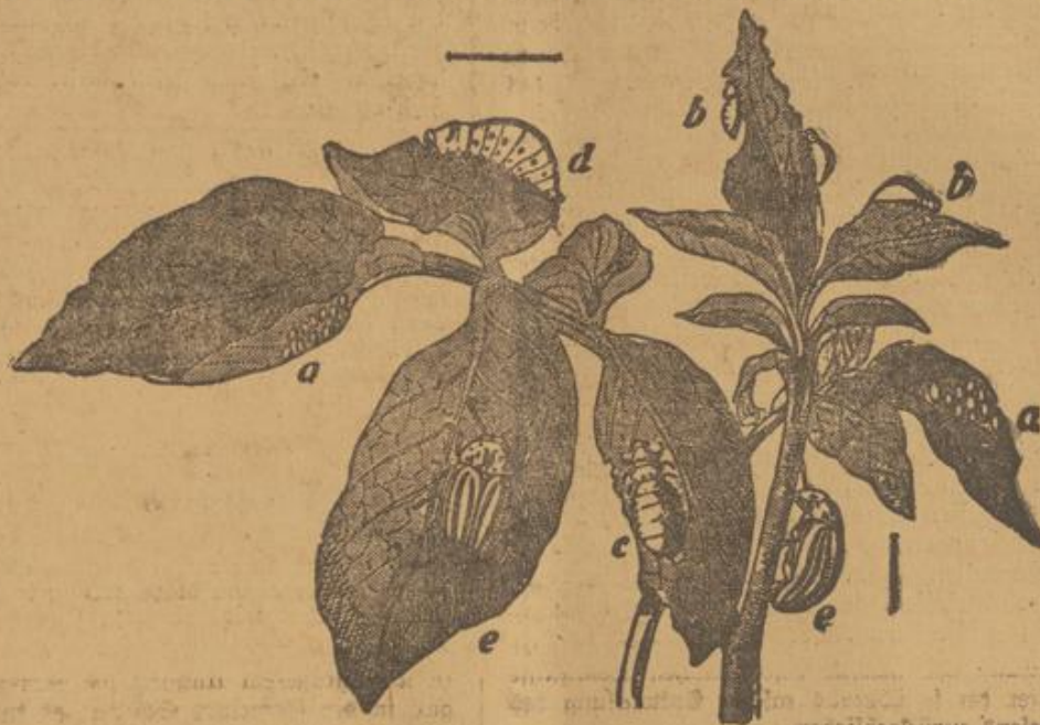
Erklärung der Abbildung. a Eier; b c d Larven in verschiedenen Altersstufen; e der Käfer. Die Abbildungen sind der größeren Deutlichkeit wegen 1\frac{1}{2} -fach vergrößert. Die wirkliche Größe ist bei der ausgewachsenen Larve d und bei dem Käfer e durch den beigegefügte Strich angegeben.

namt, ist durchschnittlich 1 Zentimeter lang, von ovalem Umriß, halbkreisförmig gewölbtem Rücken, unbehaartem, etwas glänzendem Körper und von rotgelber Grundfarbe. Von schwarzer Färbung sind die fünf verdickten Endglieder der Fühlhörner, am Kopf die Augen und ein herzförmiger Stirnfled, am Halschilder außer dem Vorder- und Hinterrande elf Fleckchen, deren mittelstes größer und von der Form einer römischen V ist, auf der Bauchseite zahlreiche in Querreihen angeordnete Punkte und Flecke, an den Beinen die Knie und die viergliedrigen Füße. Die lichtgelb gefärbten Flügeldecken zeigen zusammengenommen elf schwarze Längs-