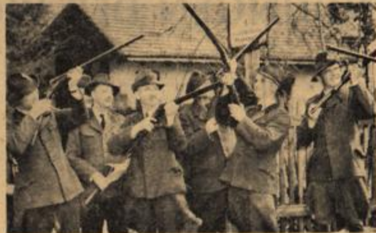
Durch die hohle Röhre gucken die Berliner Förster vorerst noch die dieser Tage wieder mit Jagdgewehren ausgestattet wurden, nachdem sie sechs Jahre keine Waffen bei sich tragen durften. Die Waffenscheine haben sie schon in der Tasche, aber die Munition wird erst noch geliefert. Die Gewehre sollen zur Bekämpfung der Schweißplage recht ausgiebig, aber nahe der Zonengrenze möglichst nicht gebraucht werden.