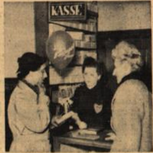
Wenn du dann müßt die Börse zücken, Erblichend an der Kasse stehst, Scheint's so, als ob dich anlich drücken Die neuen Schuh', worin' du gehst. Seit jeher drücken Seelenqualen, Muß eine Rechnung man bezahlen.