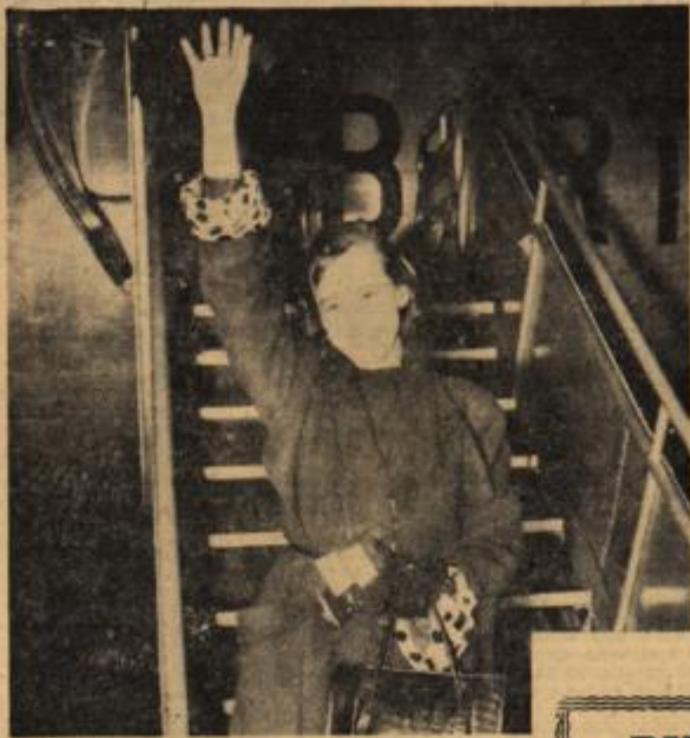
Mit strahlender Laune kam dieser Tage Maria Schell in London an, wo sie in dem Film „The Magic Box“ („Der Zauberkasten“) eine Hauptrolle spielt. Die 24jährige Maria ist Schauspielerin in der Schweiz, hat einen englischen Vertrag und wird in Deutschland als weiblicher Teil des besten deutschen Film-Liebespaars — mit Dieter Borchds — propagiert. Gerade ist der neueste Film der beiden, „Dr. Holl“, im Bundesgebiet angelaufen.