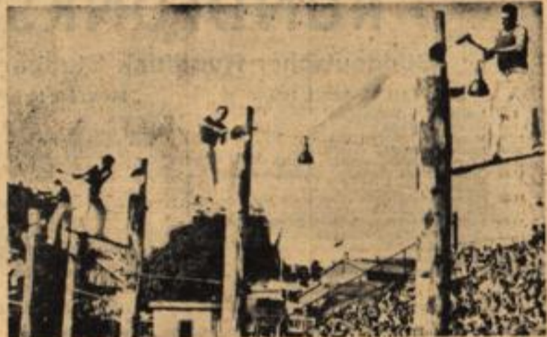
Wer fällt am schnellsten? heißt die Frage, wenn jeweils im Frühjahr in Sidney (Australien) die Weltmeisterschaft im Baumfällen ausgetragen wird. Die Titelbewerber stehen auf hohem Gerüst und gehen fadgerichtet einem vor ihnen aufgebauten Baumstamm zu Leibe. Der Weltmeister 1951 wurde Vic Summers (Australien), der schon fünfmal den Titel innehatte.