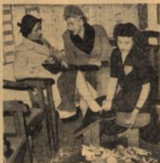
Das Lenzes holdes Knospengrüßen, Der Sonne erster heißer Kuß erinnern daran, daß den Füßen Man auch mal etwas bieten muß. So zieht man los und sucht mit Ruhe Ein Paar besonders schicke Schuhe.