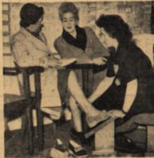
Das Personal der Schuhgeschäfte, Berühmt durch seine Höflichkeit, Stellt seine Kenntnis, seine Kräfte Der wertigen Kundenschaft gern bereit, Und dauert es viele Stunden, Bevor das richtige gefunden.