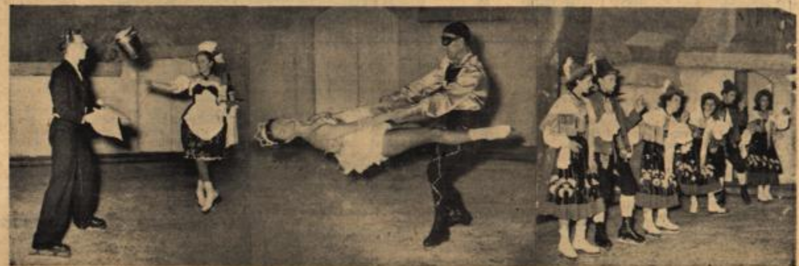
„Kaiserwalzer auf dem Eis“ heißt die Revuesensation dieses Winters, die schon in einigen Großstädten des Bundesgebietes begeistert von sich reden machte und jetzt ihren Auftritt in Hannover vorbereitet. Musik, Humor, Tanz, Artistik und so viel feuriges Temperament sind im Spiel, daß man für den eigenen Untergrund fürchten muß.