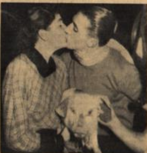
Sechs Tage kam man kaum zum Pennen. Denn das Erlebnis war zu groß. Und so ließ das Sechstagerennen Hannover von der Leine los. Es kam — das Schweinchen sah's mit Tränen — Zu ausgesprochen Liebesszenen.