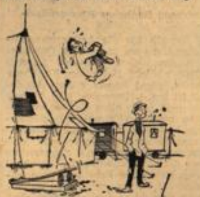
„Dieser Dummkopf vergißt doch jedesmal, daß er mich zufangen soll!“