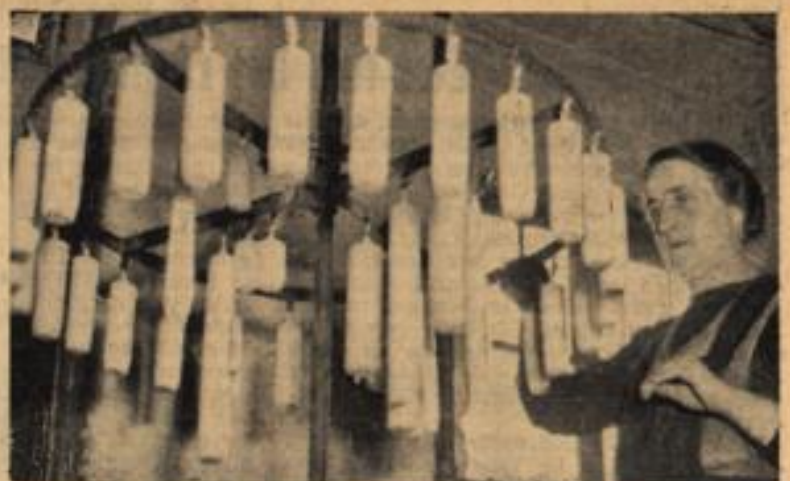
Weihnachten kündigt sich an. Das ist besonders in den Kerzen- und Wachs-fabriken festzustellen, wo die Kerzen in dichten Kränzen zum Trocknen aufgehängt werden, um bald an den Adventskränzen als Lichter zu strahlen. Viele zusätzliche Arbeitskräfte können sich in den Fabriken ihre Weihnachtsfreude verdienen.