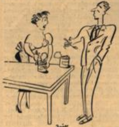
„Ach, so gut, wie wenn meine Mutter die Büchsen öffnete, schmeckt es doch nicht.“

Heute zeichneten für uns: Halbritter Bauer, Gals und Stiefbach.