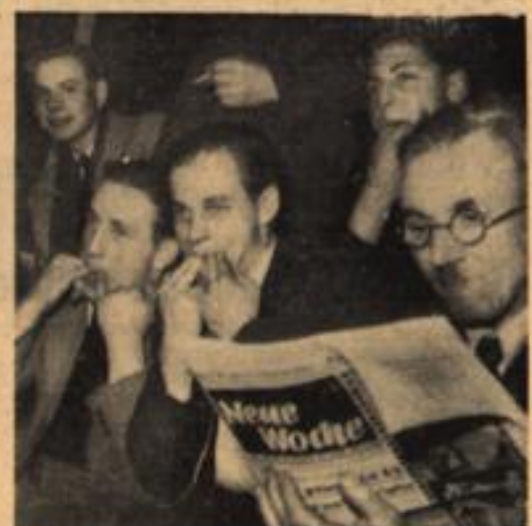
Inmitten aufgeregter Männer Sitzt hier gelassen, voller Ruh'. Des Radsports allerbesten Kenner Und schaut dem Treiben ... gar nicht zu. Er wird — so ist es stets gewesen — Es ja in seiner Zeitung lesen.