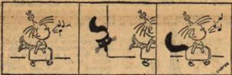
Cilli: Eßt mehr Fisch!

Der Künstler nickt zustimmend. „Ich wollte Ihnen nur sagen“, fährt der Mann fort, „daß ich hier im Dorf der Schmied bin und Ihnen sehr dankbar wäre, wenn Sie in das Lied ein paar Worte einfließen könnten, daß ich auch Motorräder instand setze...“