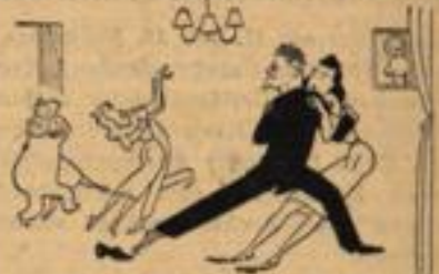
„Da hat doch wieder jemand seinen Kaugummi auf den Boden geworfen.“