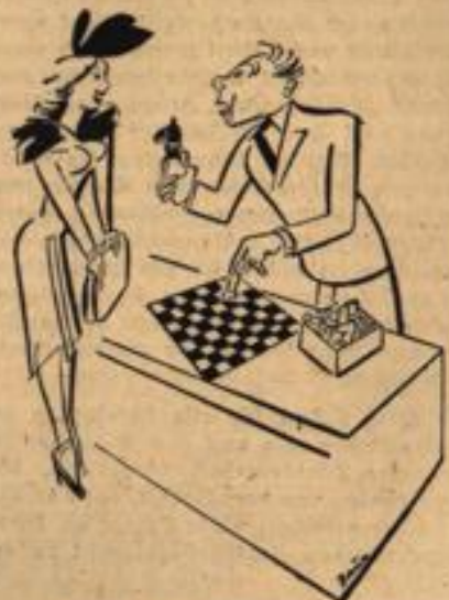
„Vielen Dank, damit wäre mir über das Schachspiel wirklich alles klar. Nur noch eine Frage — kann man es nur auf Pepitamuster spielen?“