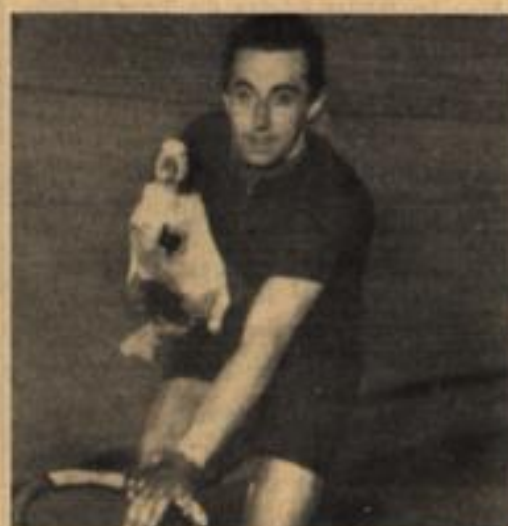
Getreulich fuhr er Rund um Runde In diesem wilden Höllenlauf. Und um die mitternäch'tige Stunde Erfuhr er jedesmal 'ne Gans. Kein Neid betraf die vielen Leute. Sie gönnten ihm die letzte Beute.