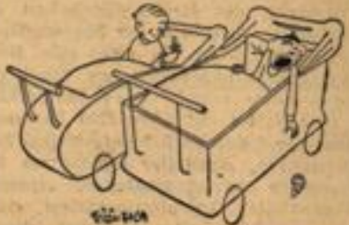
„Bitte, gnädiges Fräulein, darf ich Ihnen meinen Schnuller anbieten?“