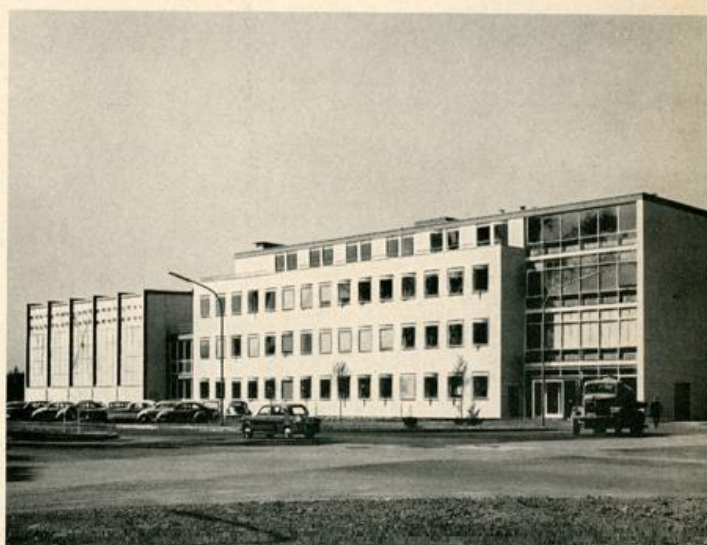
oben: Entallbivierungsanlage Mitte: Institut für Kernverfahrenstechnik