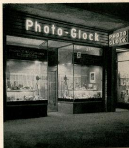
Filiale Kaiserstraße 193

Heute zählt die Firma PHOTO-GLOCK zu den bedeutendsten Photospezialgeschäften der Branche und verfügt über modernste Labors für alle Color- und Schwarz-Weiß-Arbeiten