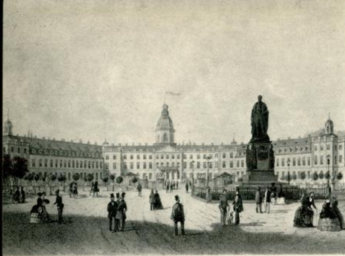
Residenzschloß Karlsruhe im 19. Jhrdt.