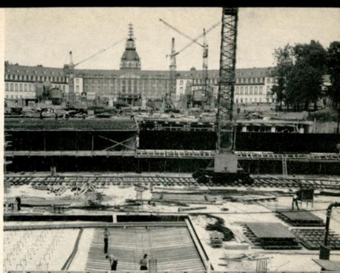
Schloßplatz-Tiefgarage im Bau