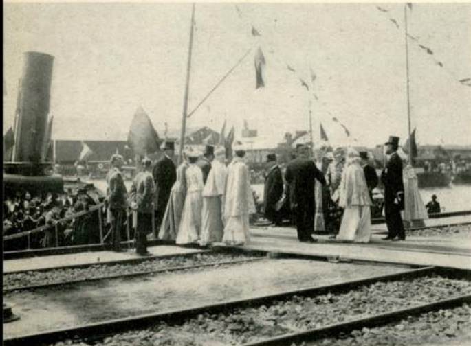
Hafeneinweihung am 27. Mai 1902