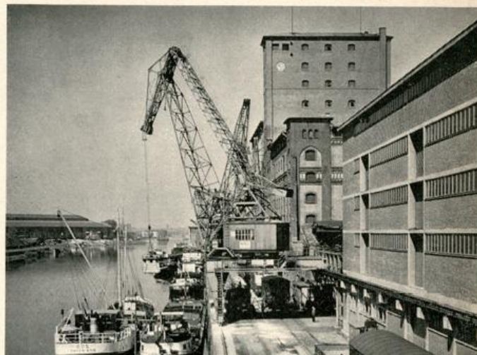
Der heutige Rheinhafen